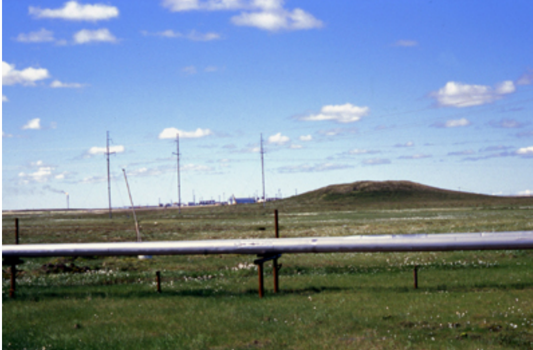
Butte cryogénique et pipeline

Lors du dégel, la fonte de la glace contenue dans les sols provoque un tassement du sol. Or, les installations humaines renforcent voire initient ce processus qui constitue un problème majeur en Sibérie du Nord. En effet, gaz et pétrole sont transportés chauds dans des pipes parfois enterrés. Autour de ceux-ci, un bulbe de dégel se développe année après année. Le premier stade s'exprime en surface par l'apparition d'eau stagnante et une modification des espèces végétales. Le pipeline devient peu à peu visible, souligné par une bande marécageuse où mousses et lichens font place à des formations de linaigrettes caractéristiques des marais.