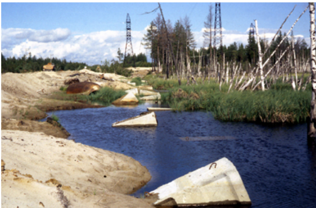
Oléoduc flottant dans une dépression thermokarstique

Le conduit finit par «flotter» dans le sol liquéfié. La corrosion s'accélère alors. En Russie septentrionale, 400 km de gazoducs se trouvent en surface de telles dépressions. De plus, le conduit est dès lors exposé aux températures extrêmes qui peuvent générer des fissures de contraction thermique. En Arctique, des incidents surviennent souvent dès les premières années de mise en fonctionnement des pipes. Or, 30% des gazoducs russes ont plus de 20 ans.