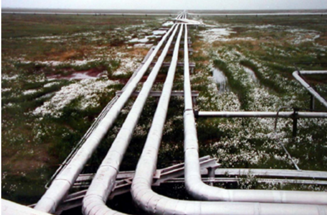
Infrastructures de l'industrie d'extraction d'hydrocarbures, dommages environnementaux et coupures des espaces de transhumance des autochtones éleveurs de rennes