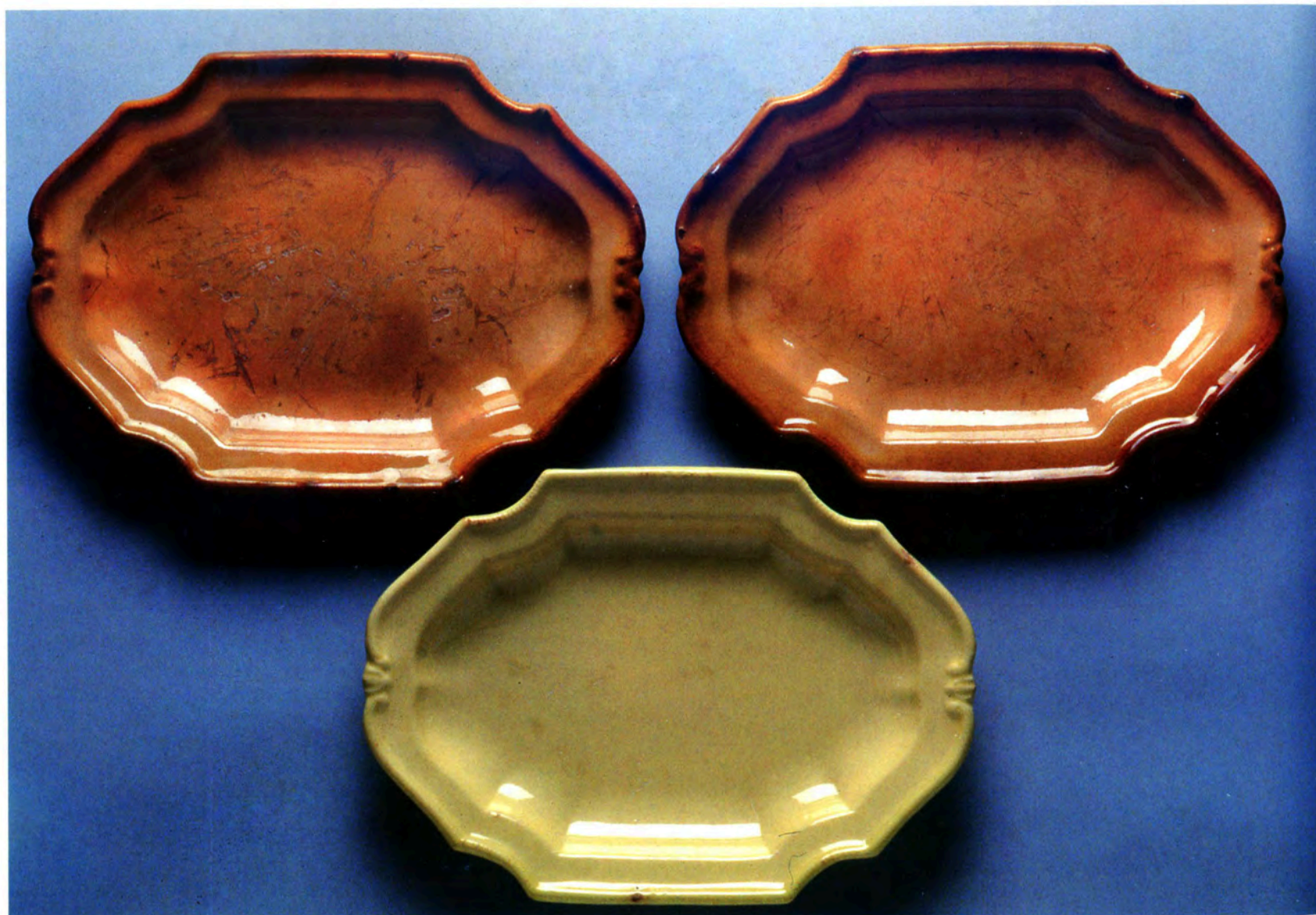
Fig. 9 : Plats timbrés de la fabrique Bousquet de Manosque et modèle d'Apt, coll. Part.