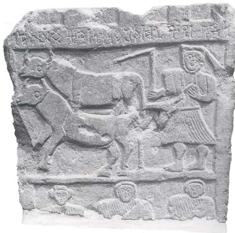
Figure 2 Dalle en calcaire représentant une scène de labour. Provenance : hautes-terres. Conservée au Musée du Louvre (Calvet et Robin, 1997, p. 110)

Une fois les céréales ou les légumineuses récoltées, il était nécessaire de procéder au battage ou au dépiquage ainsi qu'au vannage des épis ou des tiges, ceci afin de libérer les grains de leur enveloppe et/ou de les séparer des tiges. Ces opérations étaient autrefois effectuées sur une aire en terre battue ou pavée 95 . De telles structures ont été découvertes dans les régions d'altitude. Elles sont datées entre les 3 e -2 e millénaires avant J.-C. et le 1 er millénaire de notre ère 96 .