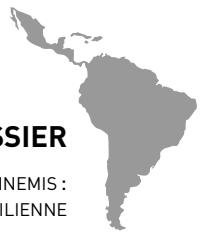
FIGURE 1. LOCALISATION DU TERRAIN D'ENQUÊTE