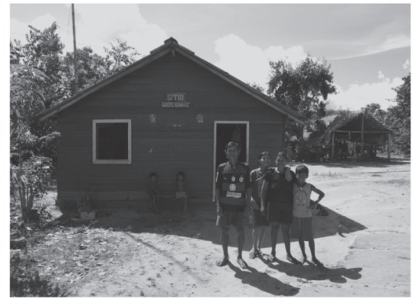
d) LAGO GRANDE (Vila Curuai, 5000 habitants)