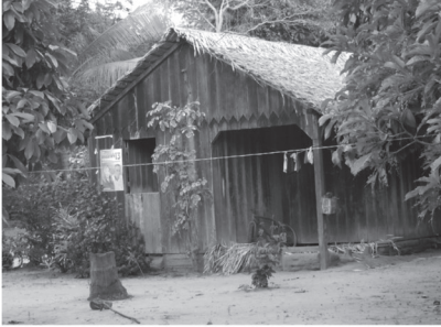
a) TAPAJÓS (FLONA, rive droite)