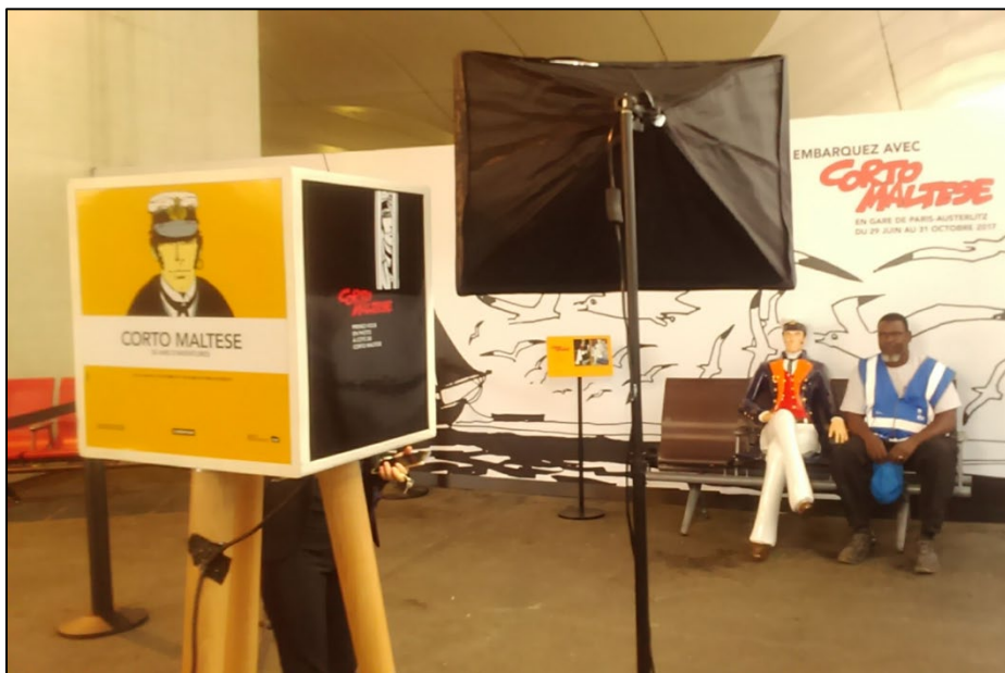
Photo 2 ; Une approche ludique de l'art en gare : Un selfie avec Corto Cliché N Baron 11/7/2017