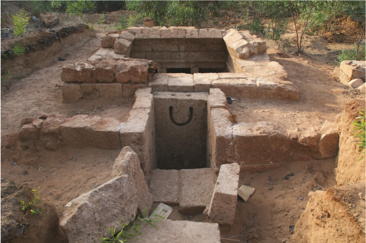
Fig. 4. Hypogée D : entrée du tombeau.