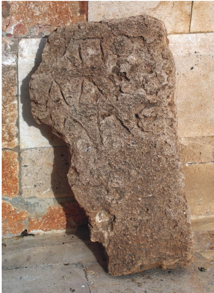
Fig. 2. Stèle funéraire d'Apollphanès (2) au musée de Ṭarṭūs.