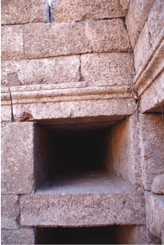
Fig. 10. Hypogée D : inscriptions 3f-g au nom de Marthoon (Julien Aliquot, 2009).