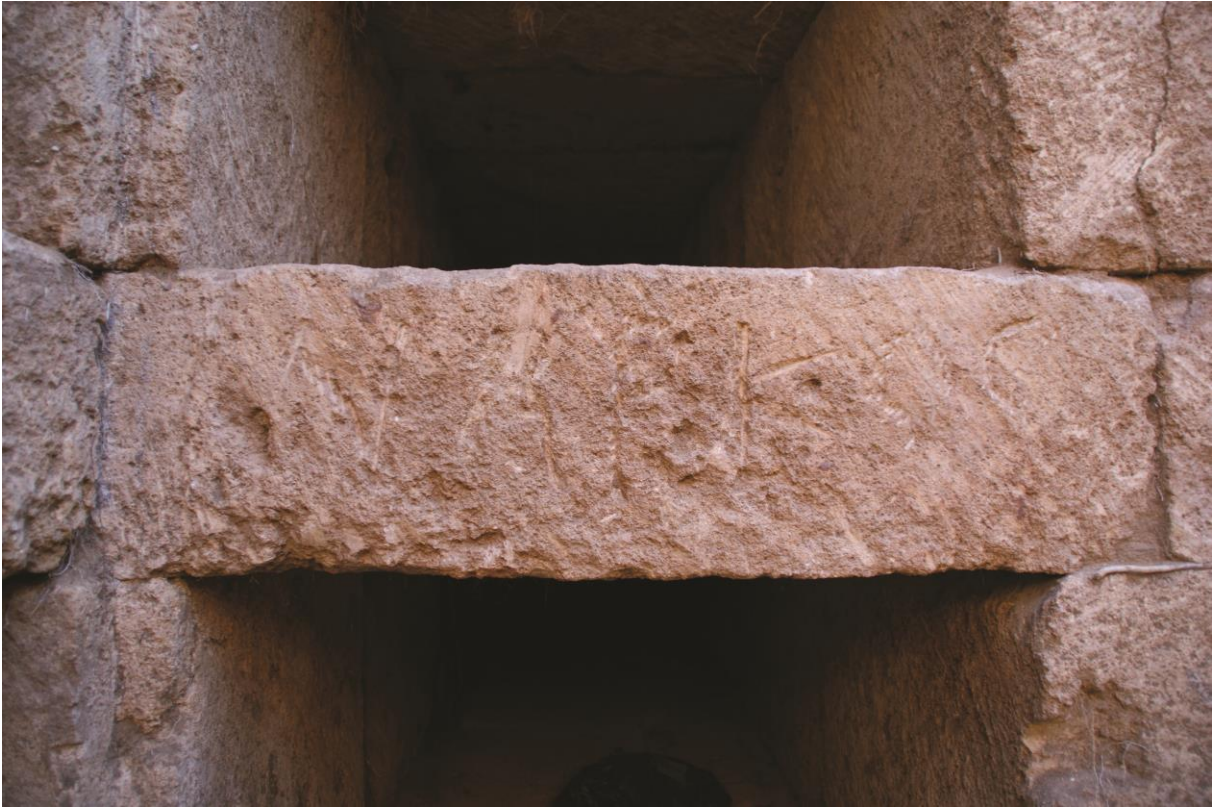
Fig. 9. Hypogée D : inscription 3e au nom de Marcus (Julien Aliquot, 2009).