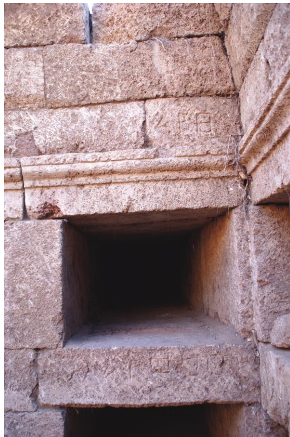
Fig. 10. Hypogée D : inscriptions 3f-g au nom de Marthoon (Julien Aliquot, 2009).