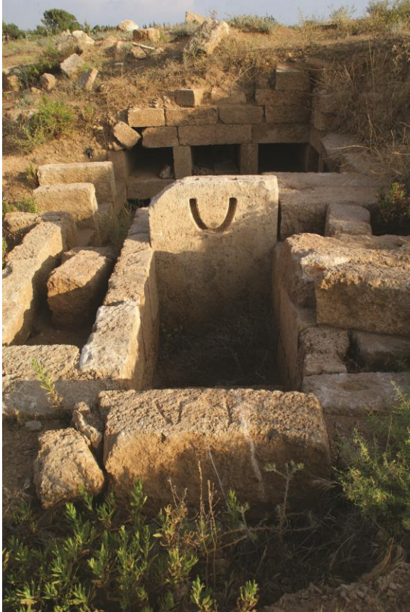
Fig. 12. Hypogée : entrée du tombeau.