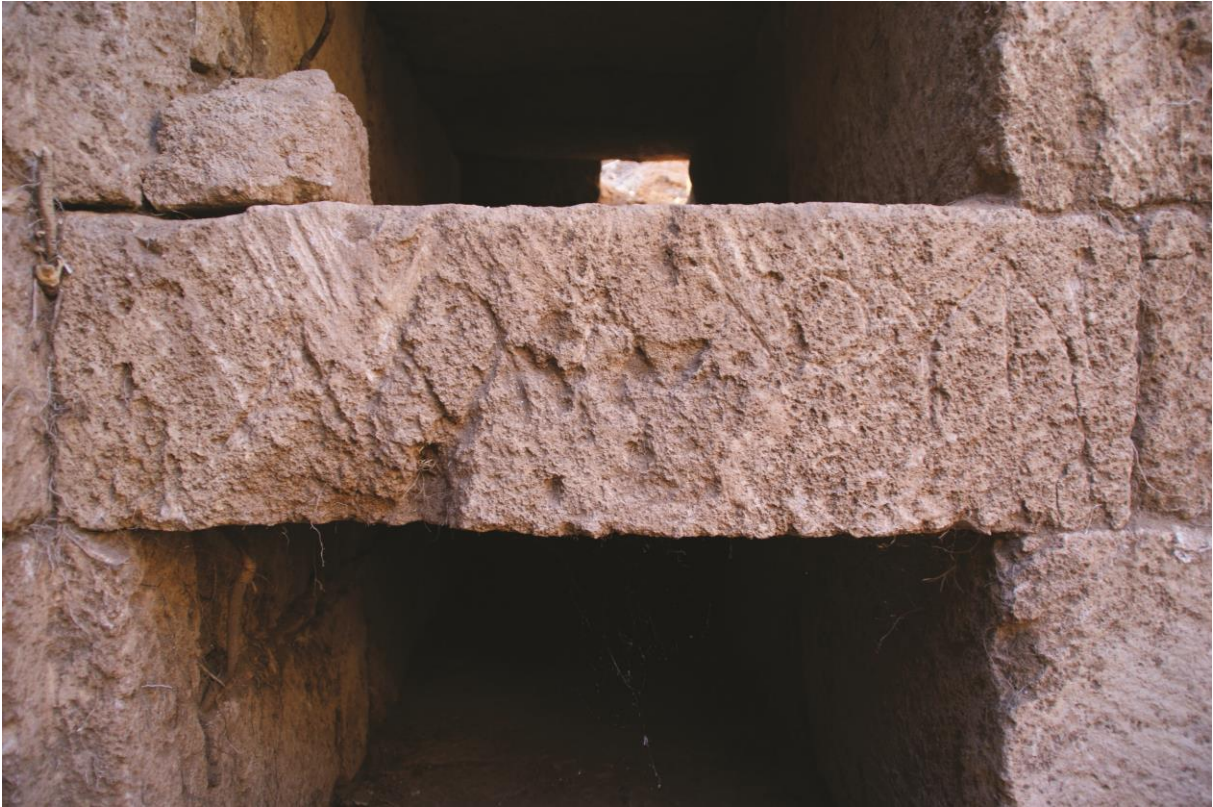
Fig. 6. Hypogée D : inscription 3b au nom d'Ammounios (Julien Aliquot, 2009).