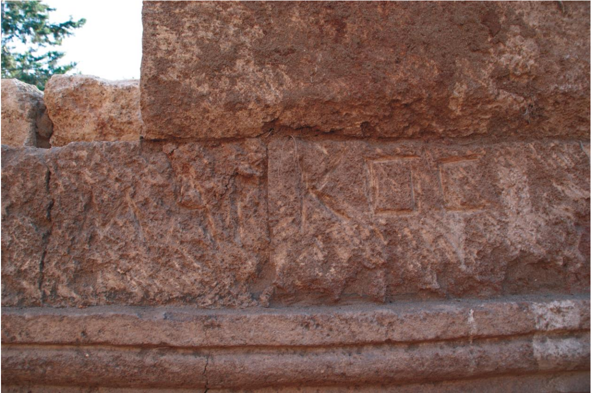
Fig. 8. Hypogée D : inscription 3d au nom de Marcus (Julien Aliquot, 2009).