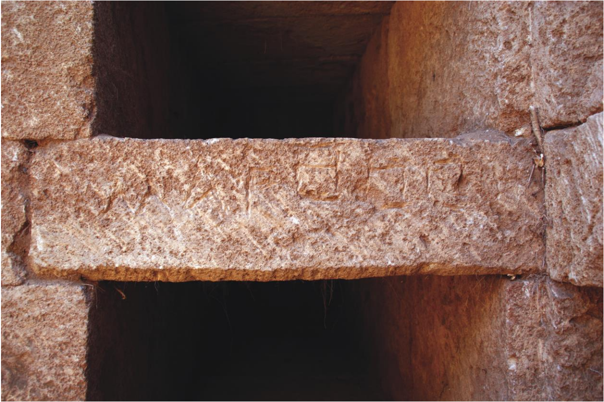
Fig. 11. Hypogée D : inscription 3g au nom de Marthoon (Julien Aliquot, 2009).