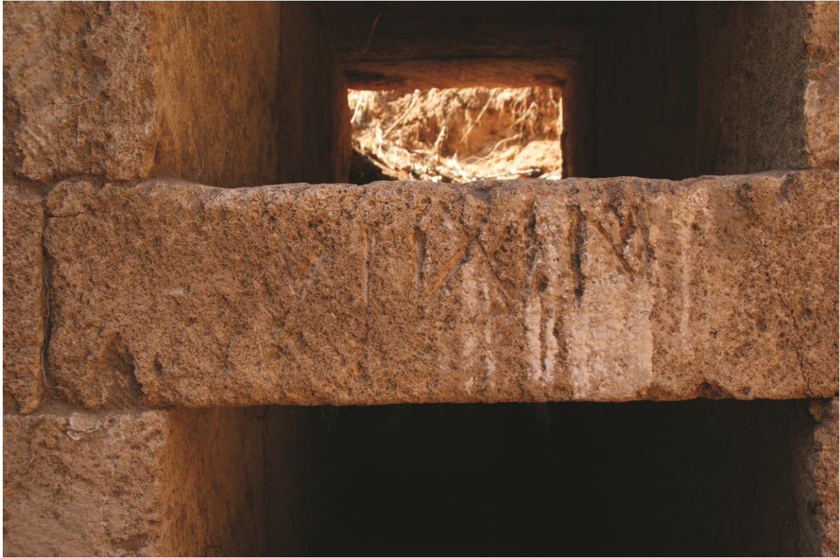
Fig. 7. Hypogée D : inscription 3c (Julien Aliquot, 2009).