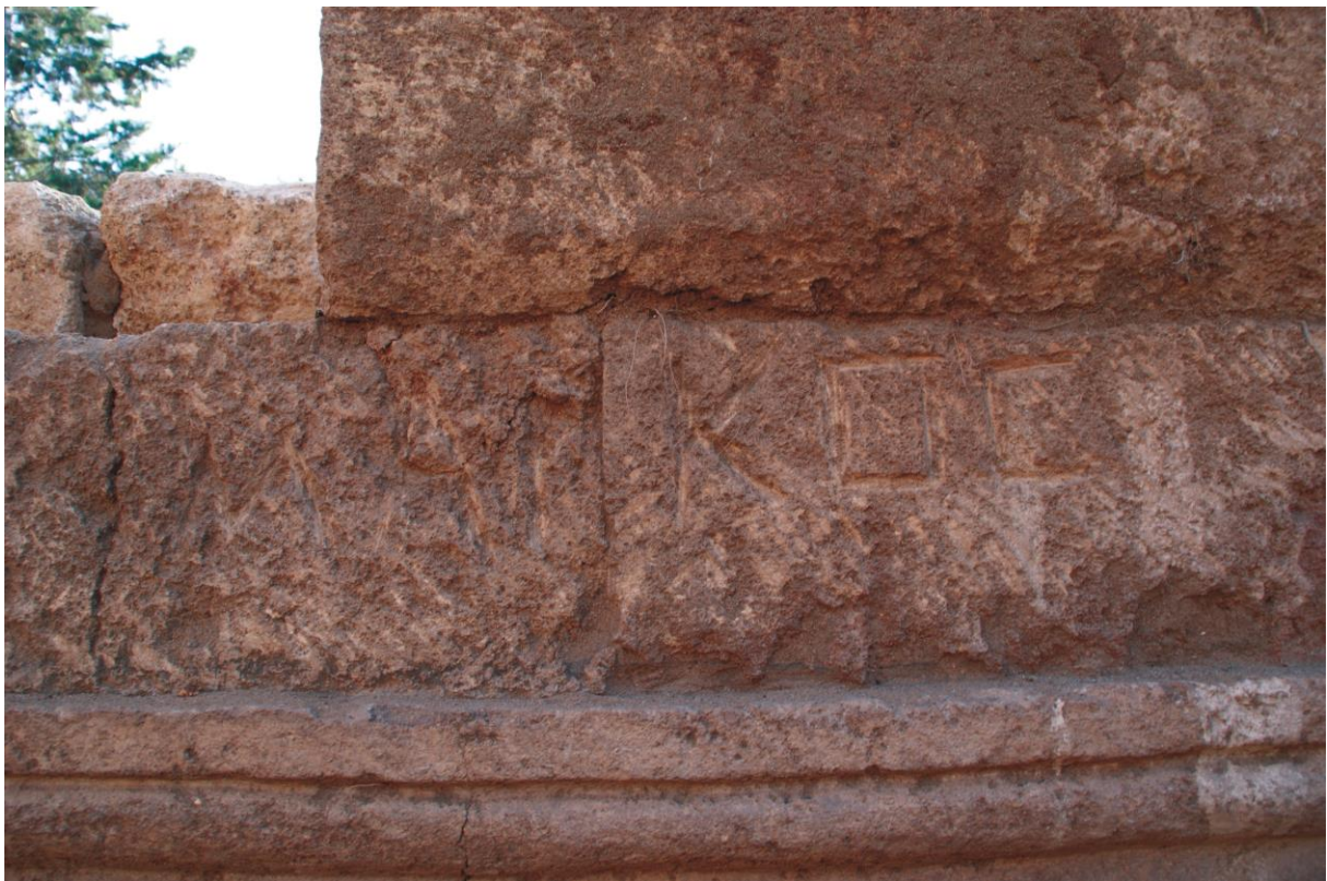
Fig. 8. Hypogée D : inscription 3d au nom de Marcus (Julien Aliquot, 2009).