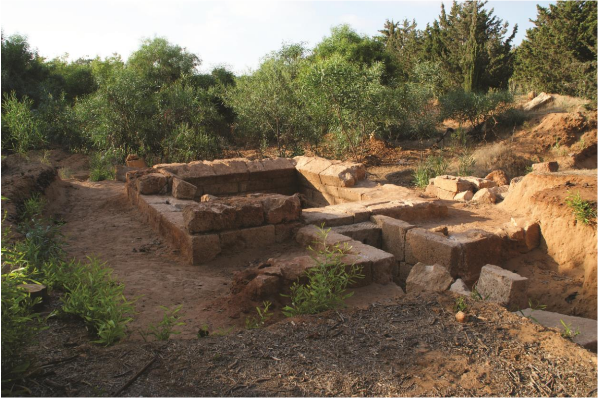
Fig. 3. Hypogée D : vue générale du tombeau (Julien Aliquot, 2009).