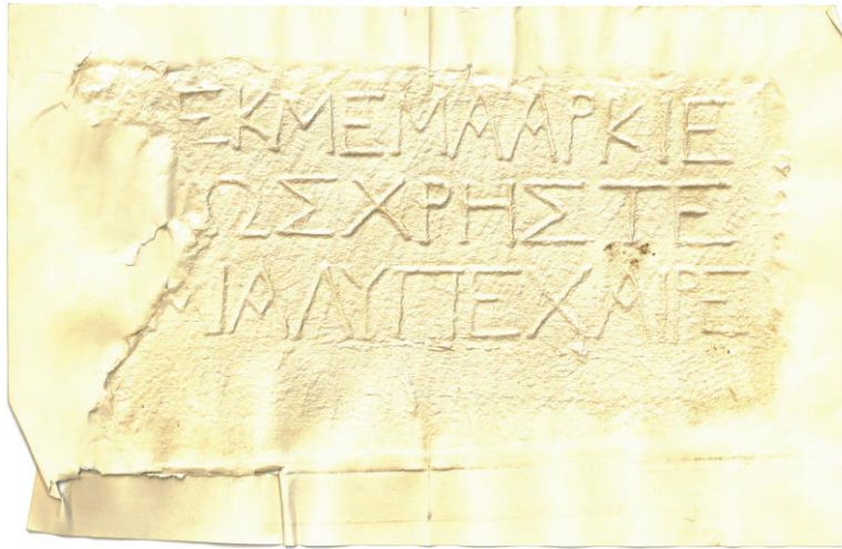
Fig. 1. Stèle funéraire de Decimus Marcius au musée du Louvre (1). Photo de l'estampage de Jean-Paul Rey-Coquais (Archives IGLS, HiSoMA, 2017).