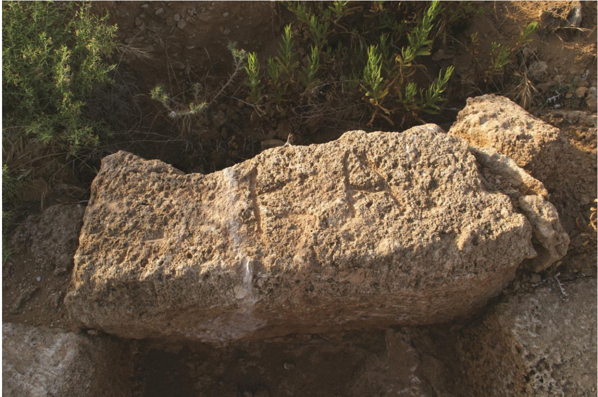
Fig. 13. Hypogée : bloc inscrit (4) à l'entrée du tombeau.