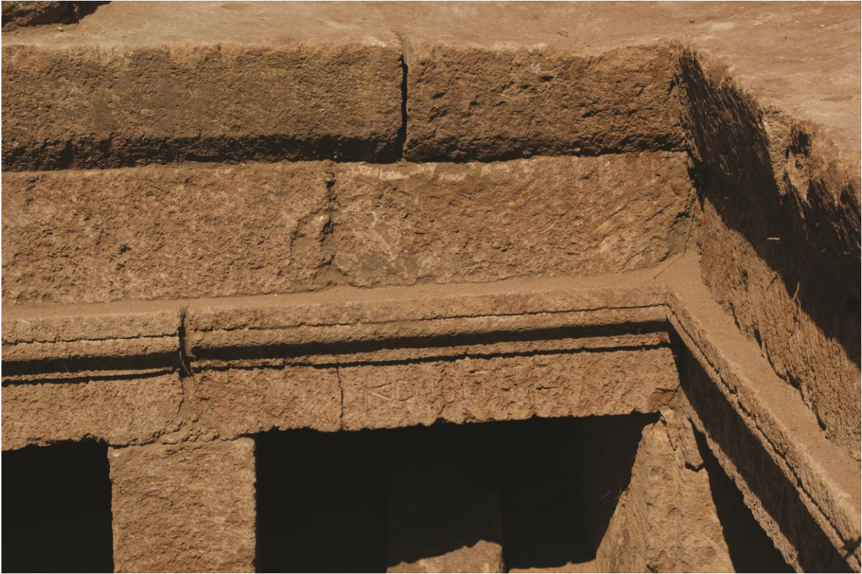
Fig. 5. Hypogée D : inscription 3a au nom de Quintus (Julien Aliquot, 2009).