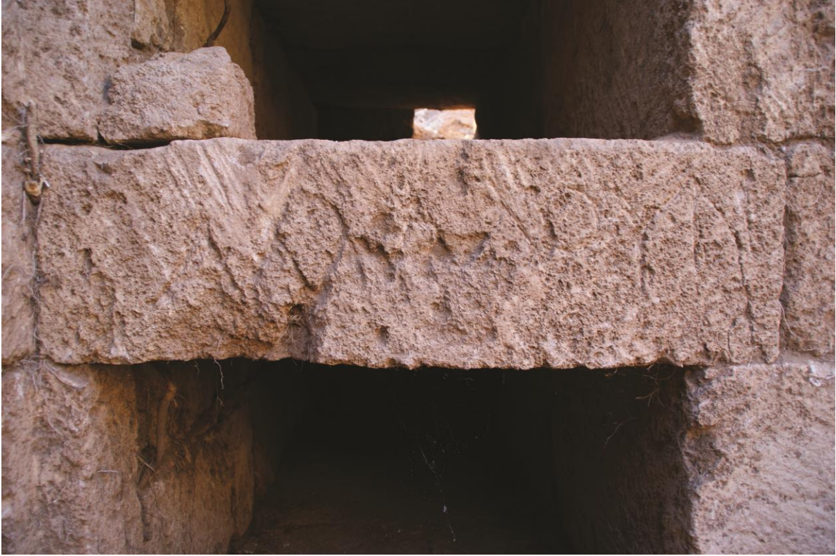
Fig. 6. Hypogée D : inscription 3b au nom d'Ammounios (Julien Aliquot, 2009).