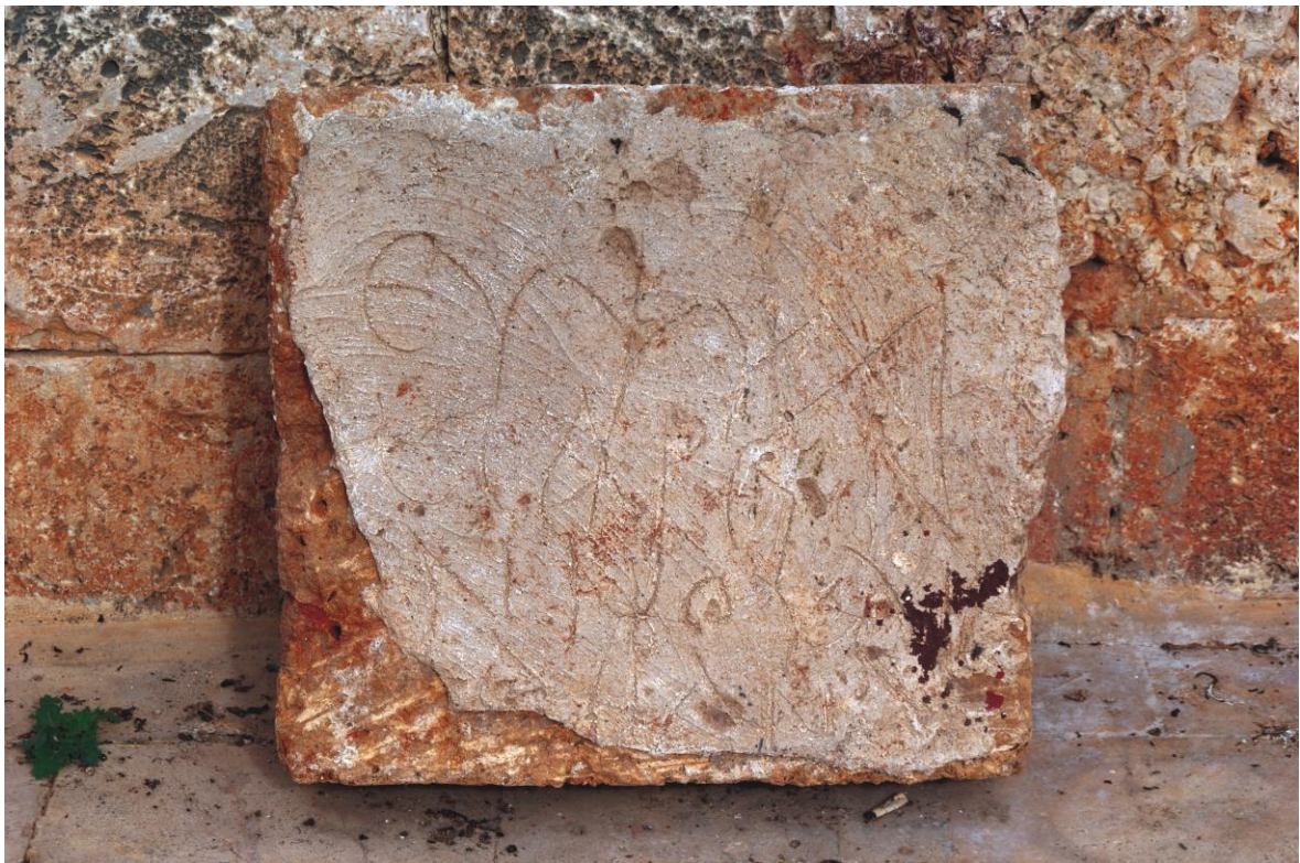
Fig. 14. Dalle de fermeture de loculus au nom de Marthanè (5) au musée de Ṭartūs.