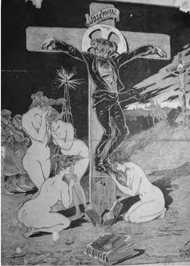
Figure 3. « Josephinus Christus », Fonds Péladan, MS 13412, feuillet 17, BNF.

plus préoccupante, que sa virilité est en jeu, lorsqu'une littérature ne rend finalement plus hommage à ses vertus morales, mais bien à sa possible chute.