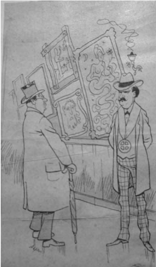
Figure 1. « Salon de la R + C », Fonds Péladan, MS 13412, feuillet.15, BNF. (D.R.)

ainsi une distinction nette avec les cas d'adolescents, d'efféminés, d'homosexuels, de célibataires ou de prêtres, qui relèvent selon lui d'un dysfonctionnement physiologique extérieur à l'hystérie. L'« hystérie virile 25 », analysée dans une série d'études de cas,