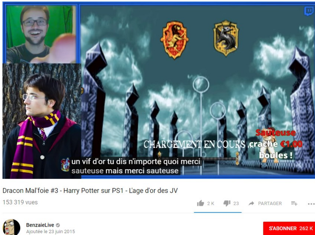
Figure 4 – Exemple d'interaction « merci Sauteuse, mer scie sauteuse » 8

De 1993 à maintenant, la pratique du speedrun a été largement popularisée avec la démocratisation d'outils de captation vidéo, permettant de montrer non plus le seul temps de fin, mais de voir et analyser la run . Il devient alors pertinent d'observer la façon dont les communautés de speedrunners mènent un travail d'histoire 9 pour retracer l'évolution d'une run considérée alors comme le produit d'une œuvre collective (Barnabé, 2014) en faisant référence et en citant des speedrunners .