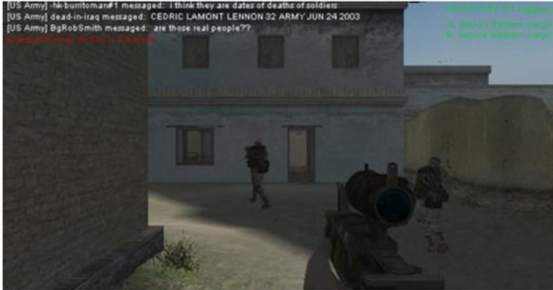
Figure 3 - Capture d'écran d'une des interventions de Joseph Delappe sur le jeu America's Army « Are those real people?? »

« Le jeu vidéo est un art autonome et en vie qui s'active sous nos doigts – que nous jouons dans l'ordre du script – que parfois nous improvisons malgré les règles données – les répliques et mouvements à ordonner. » (Pier-re, 2018 4 ).