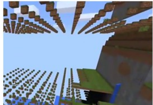
Figure 2 - A gauche : « Terrain generation, Part 1 » The World of Notch , Markus Persson 3 . A droite : capture d'écran des Far Lands

We're probably not going to fix these bugs until it becomes common for players to experience them while playing legitimately. My gut feeling is that nobody ever has so far, and nobody will. Walking that far will take a very long time. Besides, the bugs add mystery and charisma to the Far Lands.