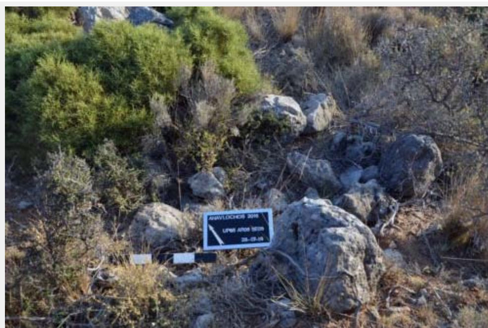
Fig. 4 : Potentielle sépulture repérée lors de la prospection 2016.

Par analogie et en se fondant sur les critères topographiques, botaniques et archéologiques (mobilier et éléments architecturaux) exposés supra , une prospection intensive du secteur visant à localiser des sépultures antiques a été entreprise. On a ainsi relevé, décrit et enregistré systématiquement une centaine de tombes potentielles, réparties en une quinzaine de groupes, souvent établis sur des éminences naturelles ou des terrasses artificielles. Le plan de petites structures circulaires ou rectangulaires était parfois lisible sous les amas de pierre et on a occasionnellement noté la présence de possibles murs d'enclos. Systématiquement, quelques tessons datés entre 1200 et 700 av. n.è., souvent de très belle qualité, se trouvaient à proximité des potentiels vestiges architecturaux repérés, alors que le mobilier archéologique faisait défaut entre les potentiels agrégats identifiés. Au terme de la campagne 2016, les limites de la (ou d'une des) nécropole(s) de l'Anavlochos ont pu être suggérées. Celle-ci se déploie sur une quinzaine d'hectares au bas des pentes et du versant Nord-Est du massif, entre deux arêtes Nord-Sud, qui descendent respectivement du sommet à l'Est et à l'Ouest du vallon central (fig.1). L'espace funéraire se poursuit dans le fond de la vallée sèche en remontant en direction de l'habitat du vallon central.