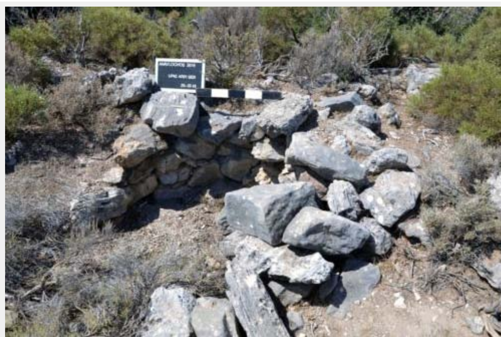
Fig. 3 : Tombe fouillée par Demargne en 1929 la mieux conservée en 2016 (© EFA/Mission Anavlochos).

Grâce à ces fouilles, bien qu'anciennes ou conduites en urgence, l'existence d'un espace funéraire dans cette région nous était donc connue et nous disposions de quelques exemples de sépultures avérées. Celles-ci présentent malheureusement un aspect très ruiné (fig. 3), du fait des pillages répétés qui ont été opérés dans ce secteur depuis le XIX e s., des travaux de construction de la route Milatos-Sissi, qui ont eu le mérite de révéler les premières tombes mais aussi de les éventrer ou de les raser, de la non-restauration ou non-consolidation des vestiges fouillés et des activités agro-pastorales récurrentes. Restait en outre à savoir comment aborder en prospection de surface pédestre un paysage que nous savions funéraire et très endommagé.