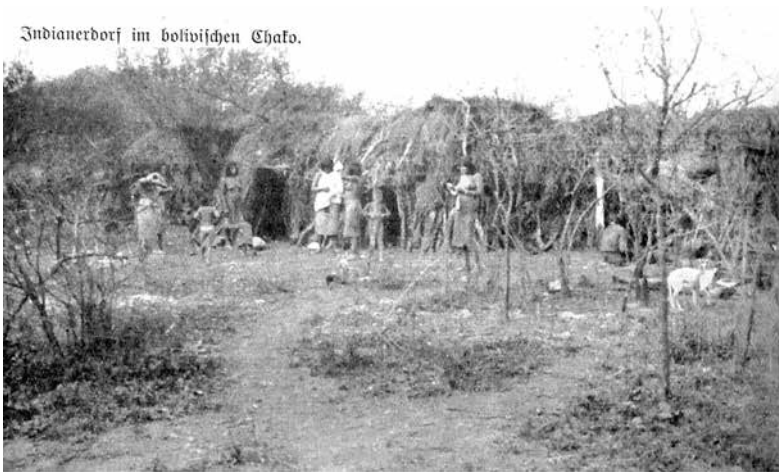
Fig. 1. Un pueblo indígena en el Chaco boliviano (MB 1930: 276)

Los períodos de epidemias destacan en los archivos y permiten formarse una imagen un poco más precisa de la distribución de los indígenas en el territorio de la PAP. Desde septiembre de 1931 habían aparecido en el pueblo indígena “de la misión” unos casos de viruela. “No creo exagerar la realidad, si calculo que haya muerto la cuarta parte de población indígena, eso serían, 3-4.000 indios” 40 señalaba el Prefecto. La viruela se expandió a los pueblos vecinos, hasta acabar con toda la población de uno de ellos, pero no pudieron aclarar cuántos pueblos, entre los más alejados, habían resultado infectados. En 1932 murieron 2.000 indígenas 41 .