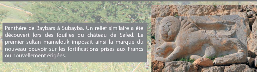
Panthère de Baybars à Subayba. Un relief similaire a été découvert lors des fouilles du château de Safed. Le premier sultan mamelouk imposait ainsi la marque du nouveau pouvoir sur les fortifications prises aux Francs ou nouvellement érigées.