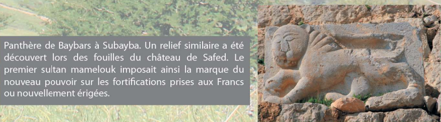
Panthere de Baybars à Subayba. Un relief similaire a été découvert lors des fouilles du château de Safed. Le premier sultan mamelouk imposait ainsi la marque du nouveau pouvoir sur les fortifications prises aux Francs ou nouvellement érigées.