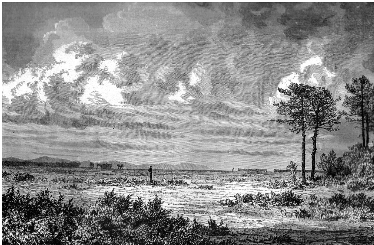
Illustration n° 2 : « Une lande dans les Landes », dessin de Franz Schrader (d'après nature) (Élisée Reclus, 1877, Nouvelle géographie universelle , t. 2 : La France, p. 97)

L'idéologie du territoire promis 25 devient alors performative par rapport à des Landes de Gascogne qui s'offrent comme une nouvelle frontière à assainir, défricher et coloniser selon une logique que ces quelques lignes de l'avocat Valery résumant parfaitement vers 1825 : « Si on vous laisse apercevoir le triste et hideux spectacle d'une longue suite de terres nues, sans population, sans abri ni contre la rigueur des hivers, ni contre l'ardeur des étés ; si, dans ces vastes solitudes ne résident çà et là que quelques habitants d'une intelligence tellement bornée qu'ils ne diffèrent des animaux que par la forme ; si l'on vous assure que ces hommes sans droits, sans devoirs, sans temple, sans culte, ignorant même le nom de leur souverain, existent, non à mille lieues du monde civilisé, mais au sein même de la France, près de tous les arts, de toutes les sciences, de tous les perfectionnements, ne verrez-vous pas là une des plus effrayantes contradictions dont puisse gémir l'humanité? Et ne provoquerez-vous pas un changement qui promette au Trésor un accroissement de revenu considérable, à la nation un grand accroissement de forces, si d'ailleurs ce changement est commandé pour des raisons politiques et morales du plus haut intérêt ? » 26 .