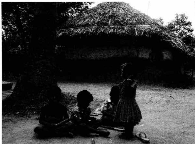
Enfants valluvar jouant devant leur maison dans le ceri (© Alexis Avdeeff – Thanjavur district – juin 2007)

ganisation spatiale de l'habitat des campagnes tamoules, comme le décrivait déjà Jean-Luc Racine il y a une vingtaine d'années : « le village [...] en pays tamoul, est une entité bipolaire où le ceri , quartier des Harijan 16 , est dissocié de l' ur (prononcer our ) où résident tous ceux, de haut ou de médiocre statut, qui échappent au stigmate de l'intouchabilité » (Racine, 1992 : 20). L'intouchabilité s'inscrit donc dans une organisation spatiale clairement définie de l'espace villageois, visant à tenir à l'écart des castes supérieures une population en état de « pollution rituelle » permanente, afin d'éviter tout risque de pollution pour les hautes castes.