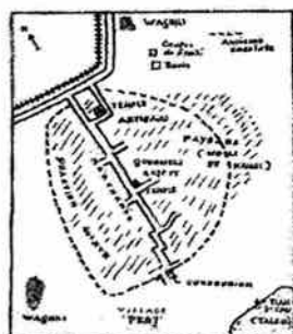
Esquisse de la localisation des différentes communautés du village de « Praj », Saurashtra, Gujarat. Échelle approximative 1/10 000 © H. Tambs-Lyche

Les habitations des Waghri étaient situées « hors des murs » ; et même si les murs de Praj étaient en ruines, leur tracé était connu de tous. Une centaine de mètres séparaient leurs cabanes des enceintes du village. Alors que les maisons des autres castes étaient en pierre ou en terre sèche, des branches et des sacs de jute constituaient les seuls matériaux autorisés pour les huttes waghri, qui ne devaient jamais s'élever à plus d'un mètre et demi environ. P. G. Shah essaie d'expliquer la mauvaise qualité de ces habitations par l'origine « nomade » de la caste : pourtant, à Praj, ce type d'habitat rudimentaire leur était clairement imposé.