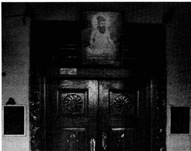
Représentation de Tiruvalluvar accrochée au-dessus de la porte d'entrée d'une maison de Valluvar.

emploie l'image et le nom du poète tamoul pour sa gazette pluriannuelle Valluvam pecukiratu , sur la couverture de laquelle Tiruvalluvar est représenté debout sur un globe terrestre, tenant un eluttani (stylet) dans sa main droite et un olai cuvati (recueil en feuille de palmier) dans la gauche – instruments d'écriture et de travail qui étaient, il y a encore un demi-siècle, ceux des astrologues et des médecins valluvar. À travers cette réappropriation de la figure de Tiruvalluvar, la communauté valluvar se pare d'un ancêtre des plus prestigieux. Le saint poète tamoul incarne la fierté et la dignité de la communauté valluvar mais, au-delà, contribue à glorifier une identité de caste qui s'en trouve renforcée, tandis que son aura de sagesse millénaire vient appuyer la réputation déjà bien établie des Valluvar dans leur pratique de l'astrologie et de la médecine.