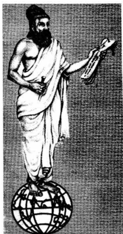
Symbole de la fierté valluvar, Tiruvalluvar tel qu'il apparaît sur la couverture de la gazette du sangam, debout sur le globe terrestre et tenant dans ses mains un stylet et un recueil de palmes.

Au terme de notre étude portant sur ces deux communautés d'«intouchables», il apparaît que des dynamiques sociales importantes, toujours à l'œuvre, ont contribué peu ou prou à effacer les marques et les signes distinctifs imposés à ces castes traditionnellement discriminées. De manière paradoxale, certains de ces signes semblent même avoir été