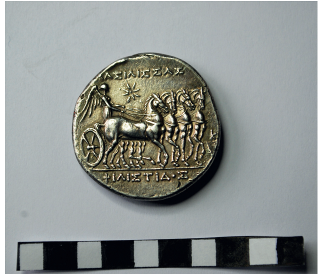
Figure 4 Philistis. Tétradrachme (revers). Collection Musée Saint-Raymond Toulouse (2000.15.10)

de drachmes. Si l'on s'appuie sur leurs valeurs pondérales, ces monnayages semblent répondre à une sorte d'organisation monétaire hiérarchique voulue par Hiéron II : les monnaies d'argent les plus lourdes sont à son portrait, puis viennent les monnaies de son épouse et enfin celles de son fils [35]. Cette hiérarchie royale correspond du reste à la mise en scène des inscriptions telle qu'on l'observe dans le théâtre, Hiéron II se situant au plus près de Zeus Olympios. D'autres problèmes se posent cependant et concernent l'ensemble des monnayages d'argent associés à la dynastie hiéronienne. Le premier qui reste très discuté par les numismates est celui de la