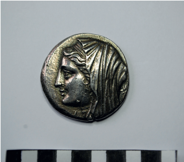
Figure 3 Philistis. Tétradrachme (droit). Collection Musée Saint-Raymond Toulouse (2000.15.10)