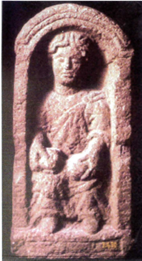
Fig. 88 - Stèle funéraire découverte dans le secteur des auberges (Musée des Antiquités Nationales).