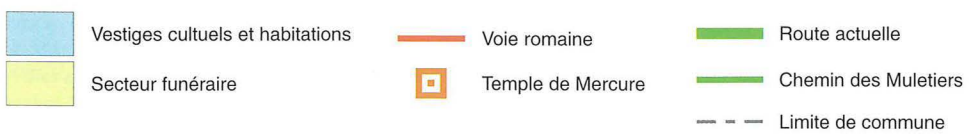
Fig. 89 - Extension présumée de l'agglomération d'Ubrilium (F. T.)