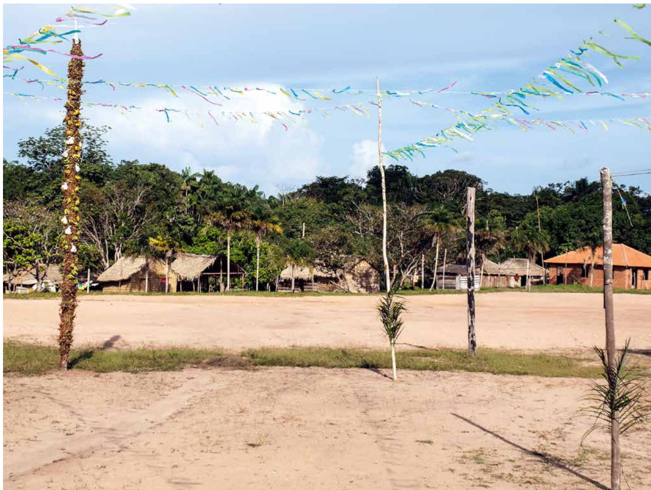
fig. 3 Aperçu du village de Notre-Dame de Fátima, avec le mât votif érigé en premier plan, 2011 © Émilie Stoll.