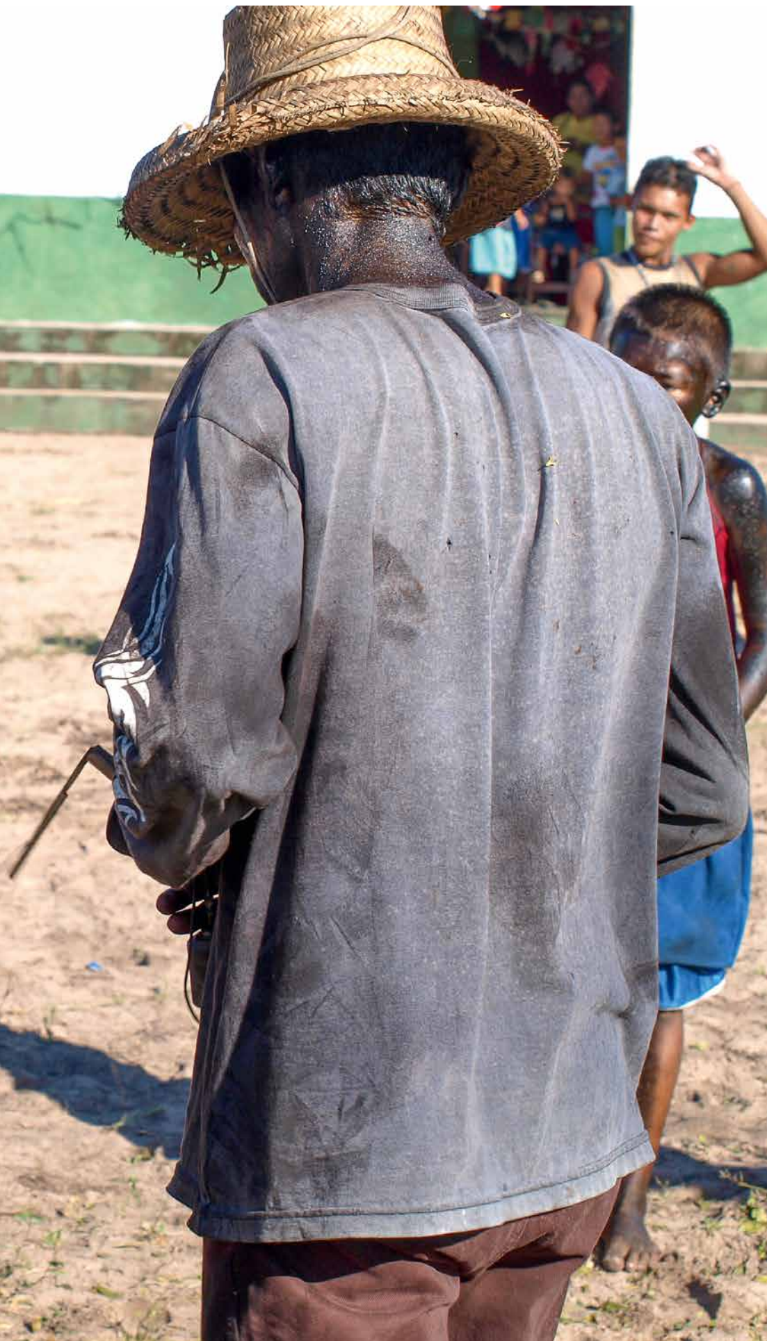
fig. 7 La naissance du bébé des pretos , 2011 © Émilie Stoll.