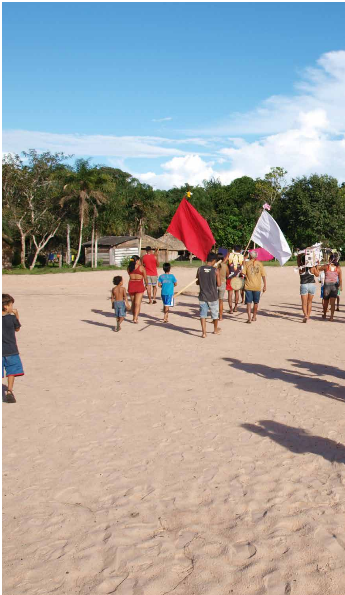
fig. 4 Les villageois se rendent à la cérémonie, 2011 © Émilie Stoll.