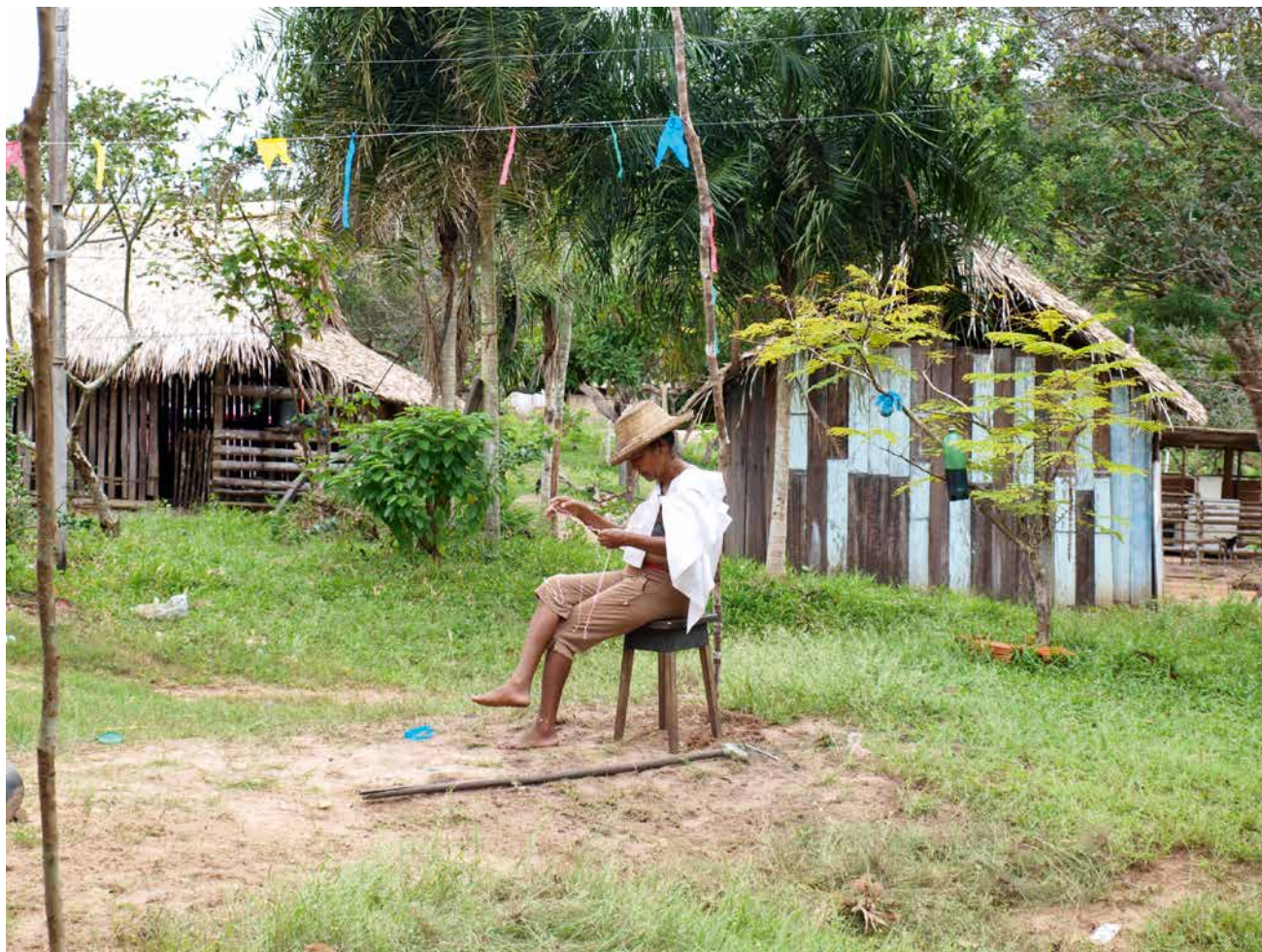
fig. 1 Préparation des ornements de la chapelle, 2011 © Émilie Stoll.

1. Nous avons choisi de traduire pretos par « Nègres » en raison du caractère purement grotesque et burlesque de ces personnages, insistant sur les attributs stéréotypés du Noir. Dans la région de Santarém, les Noirs sont réputés être des descendants d'esclaves.