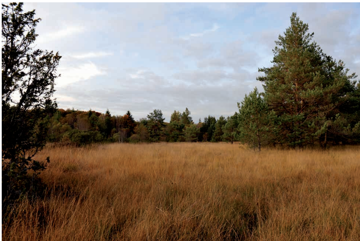
Fig. 4. Tourbière de L'Eclache