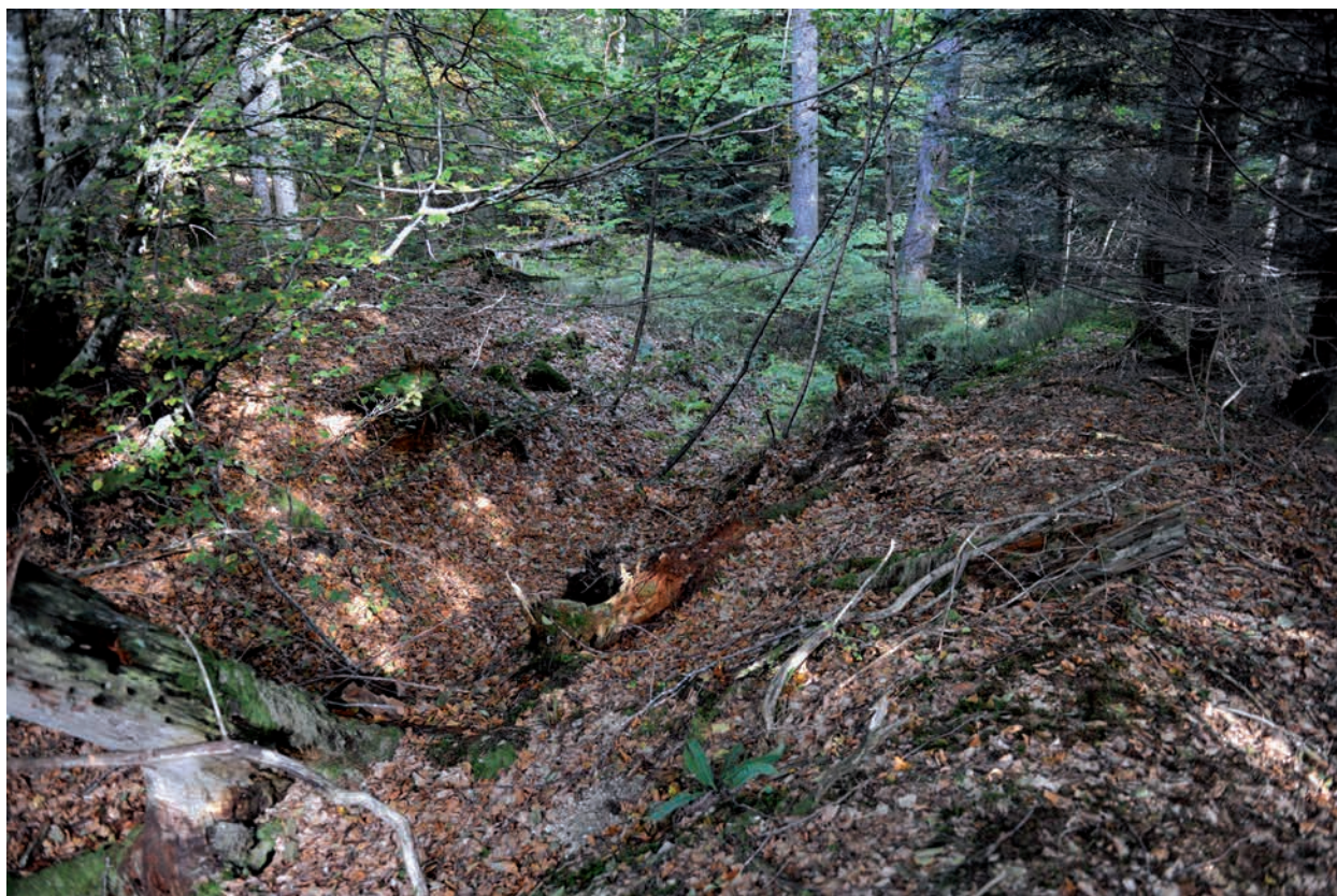
Fig. 2. Minière de la forêt domaniale de L'Eclache (Prondines)