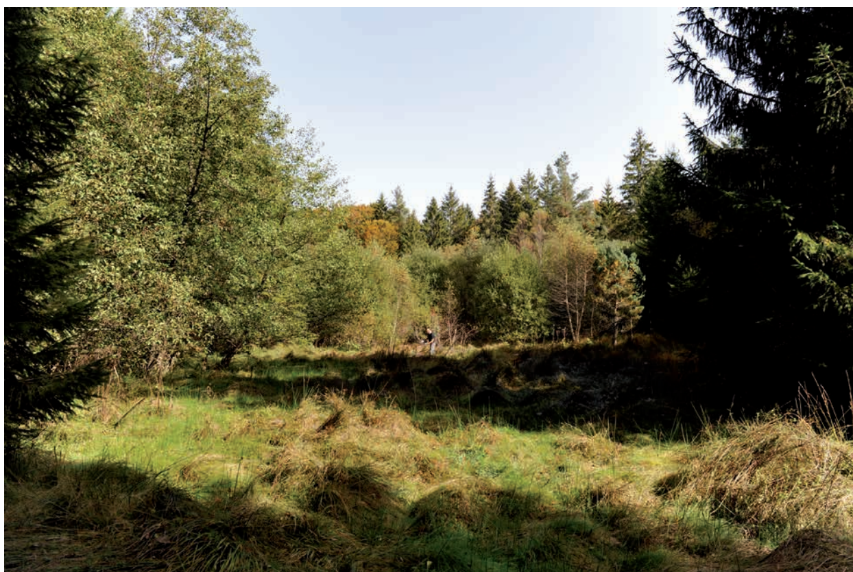
Fig. 3. Tourbière de la forêt domaniale de L'Eclache (Prondines)