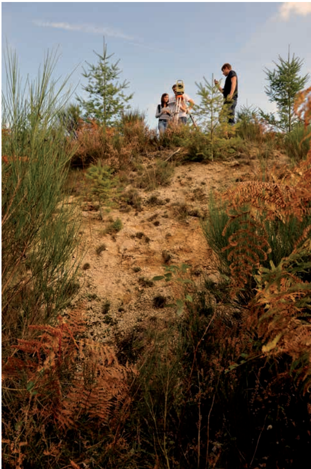
Fig. 6. Halde/dépôt de la minière/laverie de La Verrerie (Villosanges)