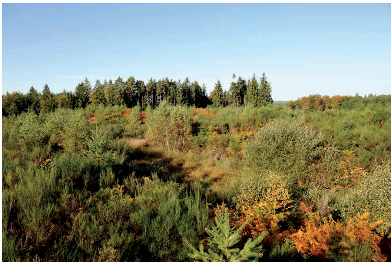
Fig. 5. Tourbière formée dans la minière/laverie de La Verrerie (Villosanges)