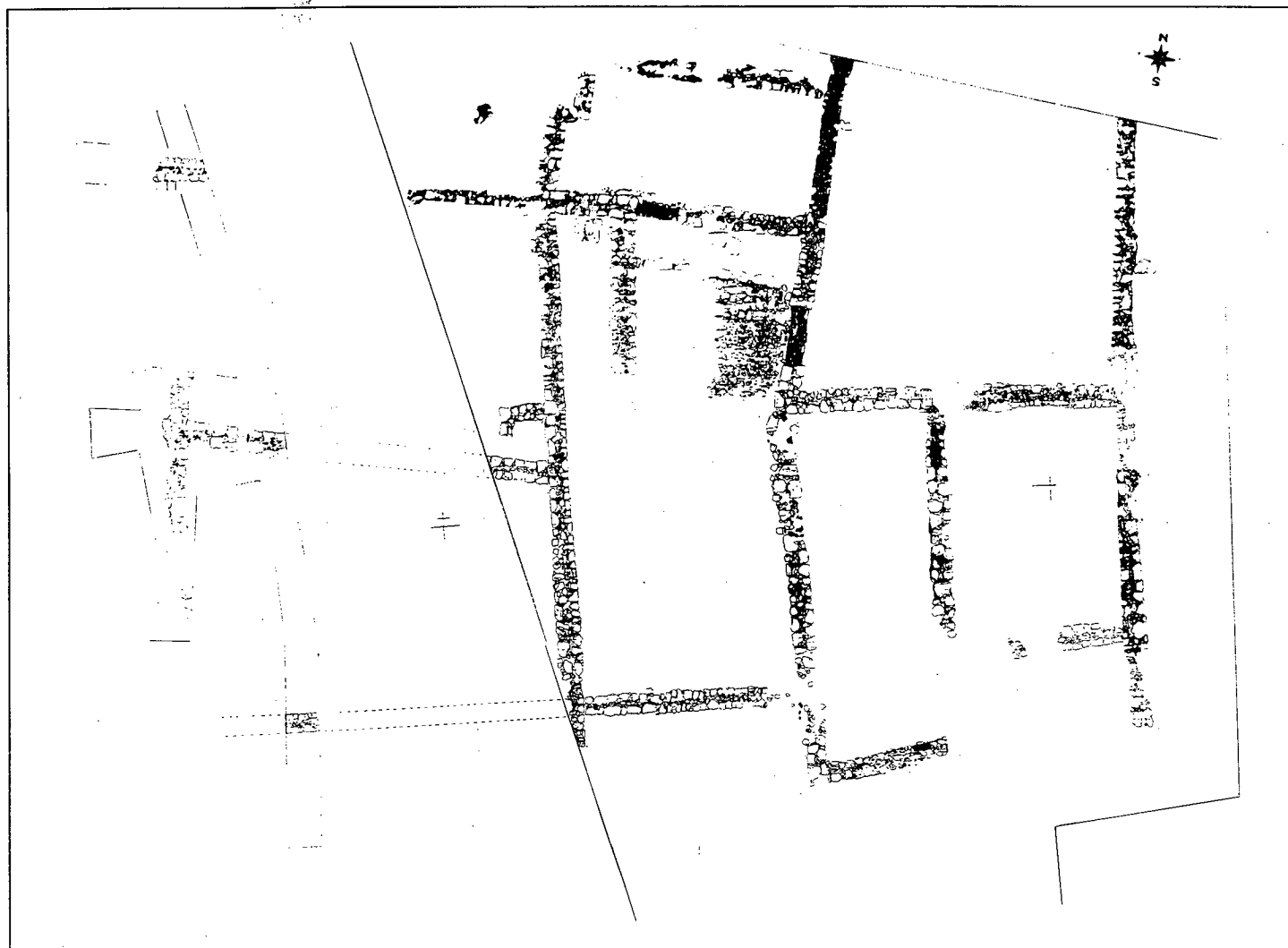
fig. 42 SAINT-MITRE-LES-REPARTS, Les Soires. Plan de l'établissement [échelle : 1/200].

double parement de blocs irréguliers et grossièrement équarris à blocage interne d'argile ; les autres sont bâtis en petits blocs irréguliers noyés dans un épais mortier de chaux.