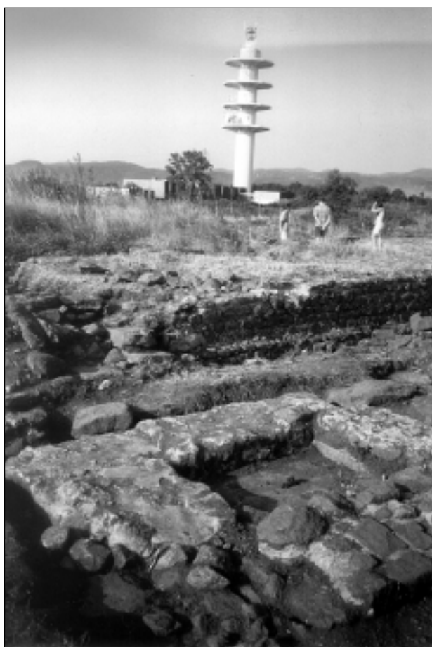
Fig. 1 : BLANZAT – La Reine – sanctuaire des Côtes de Clermont : dégagement du fanum et de la structure F