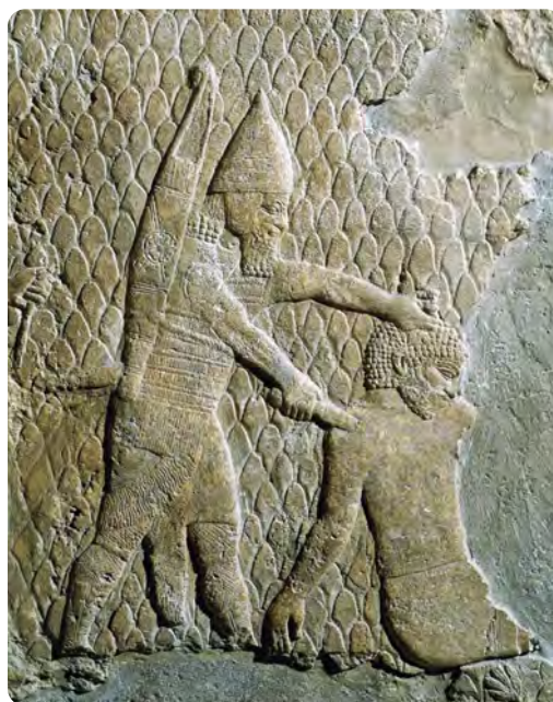
Scène de guerre, Ninive (R.D. Barnett et al., 1998, Sculptures from the Southwest Palace of Sennacherib at Nineveh, BMP, Londres : 434c)

Première surprise : l'omniprésence affirmée de la guerre dans le quotidien des peuples du Proche-Orient