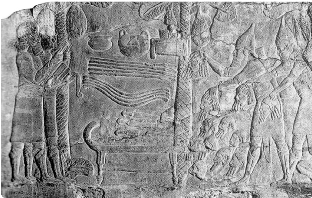
Dépôt de têtes coupées devant des scribes, Ninive (Barnett et al. 1998, pl. 195)