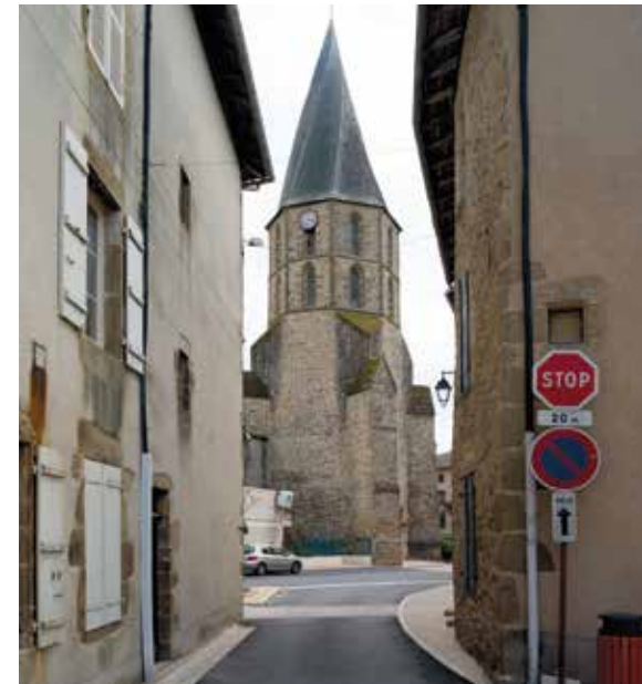
L'église de Rochechouart.