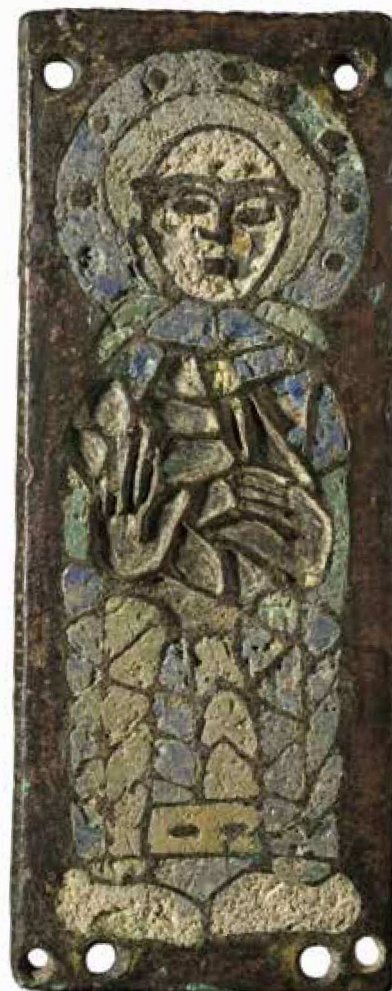
Moine tenant un livre, XI e siècle, plaque émaillée, musée Sainte-Croix.

Au musée Sainte-Croix de Poitiers, un nouvel espace intitulé «D'un empire à l'autre. Premiers temps chrétiens en Poitou, IV e -IX e siècle» permet d'admirer les pièces sculptées provenant de l'hypogée des Dunes, choisi par Mellebaude, abbas mérovingien, pour y établir sa sépulture.