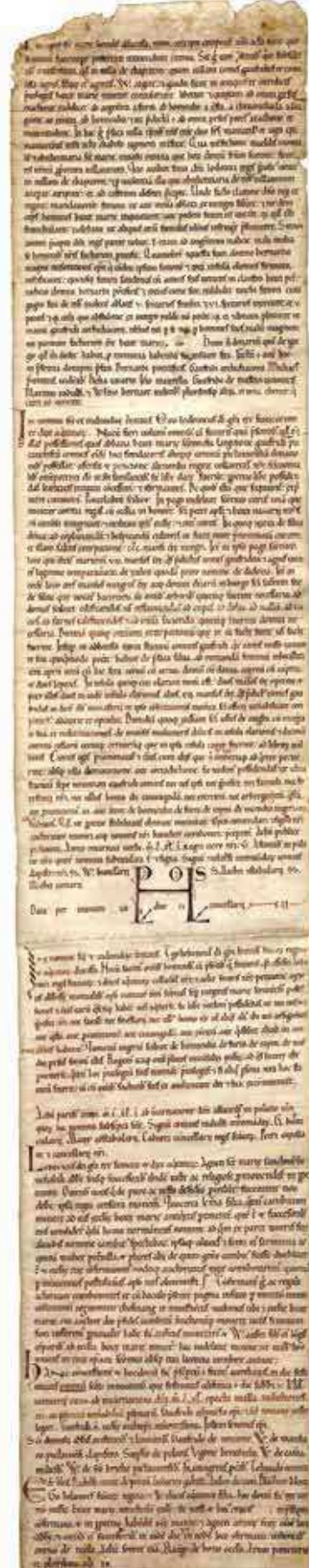
Charte-rouleau de l'abbaye aux Dames, XII e siècle. Archives départementales de Charente-Maritime

PRÉSERVER. Ce programme vise à réunir et à mettre à disposition du public le plus large possible, celui des universitaires comme celui des amateurs, travaux et documents concernant les abbayes et prieurés de la région au Moyen Âge. Privilégiant un «retour aux sources», il s'attache à répertorier, éditer et traduire textes et archives tout en initiant ou stimulant des études thématiques et en alimentant un inventaire des établissements à l'échelle nationale. Articulé avec un