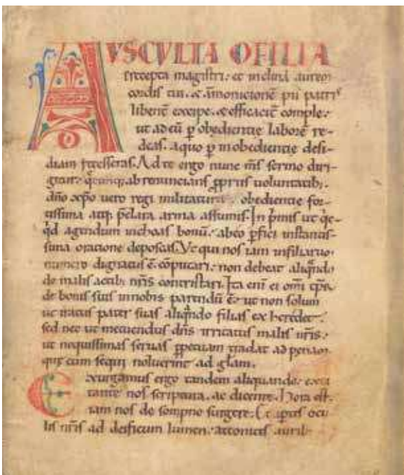
Règle bénédictine pour les femmes (abbaye aux Dames de Saintes), XII e siècle. Yale University, Beinecke Library, ms Marston 25, 129 r .

À ce titre, on ne peut s'empêcher de considérer comme miraculeuse la conservation de documents remontant, parfois, à plus de mille ans. Tant de choses ont en effet péri de ce que les moines ont écrit. Cependant, la moisson peut être fructueuse si l'on s'arme de patience et de persévérance pour retrouver les manuscrits provenant des abbayes de la région. Et quelle émotion de contempler à la médiathèque de Poitiers l'évangélaire de Sainte-Croix ou de tenir dans ses mains aux archives de Limoges un véritable diplôme de l'empereur Louis le Pieux, du début du IX e siècle ; quelle chance de pouvoir feuilleter la somptueuse bible enluminée de Saint-Yrieix conservée à la bibliothèque municipale du lieu, même si elle n'est «que» du XII e siècle.