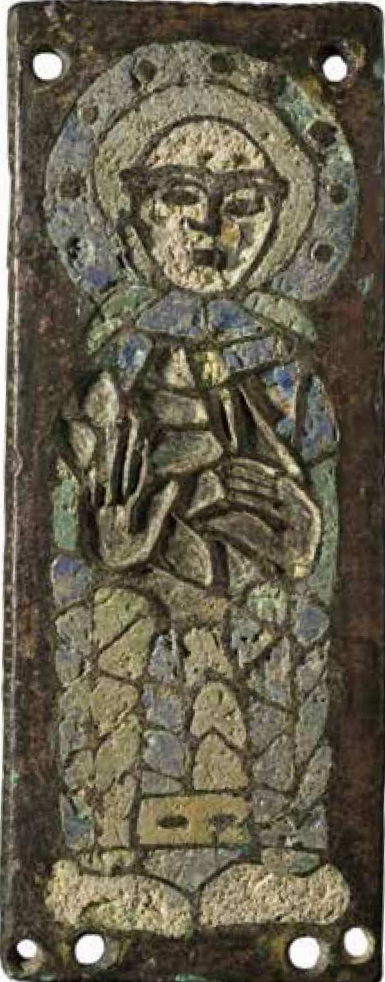
Christian Vignaud - Musées de Poitiers

MELLEBAUDE, UN ABBAS MÉROVINGIEN Au musée Sainte-Croix de Poitiers, un nouvel espace intitulé «D'un empire à l'autre. Premiers temps chrétiens en Poitou, IV e - IX e siècle» permet d'admirer les pièces sculptées provenant de l'hypogée des Dunes, choisi par Mellebaude, abbas mérovingien, pour y établir sa sépulture.