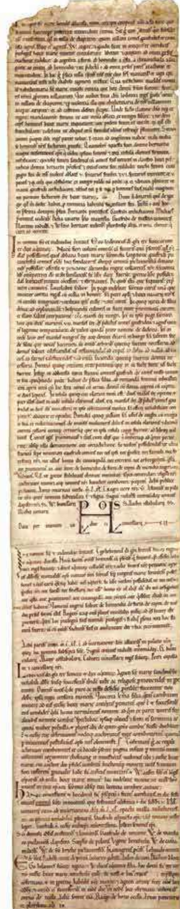
Charte-rouleau de l'abbaye aux Dames, XII e siècle. Archives départementales de Charente-Maritime