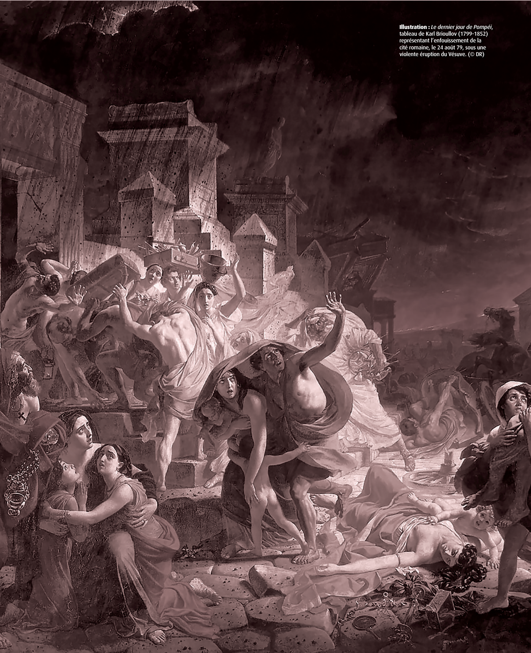
Illustration : Le dernier jour de Pompéi, tableau de Karl Brioullov (1799-1852) représentant l'enfouissement de la cité romaine, le 24 août 79, sous une violente éruption du Vésuve.