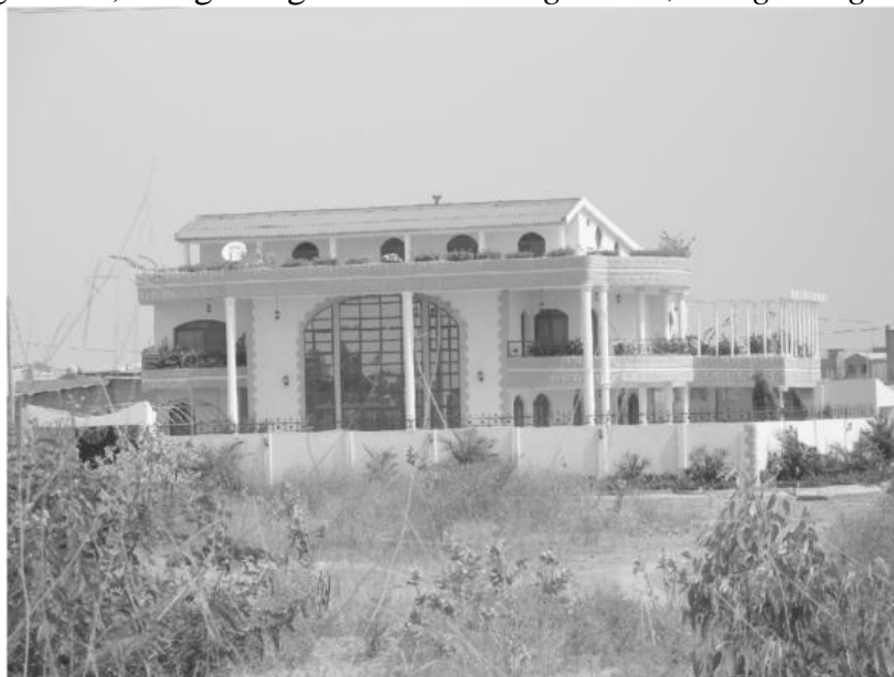
Fig. 5 - Villa à Ouaga 2000, Ouagadougou Villa at Ouaga 2000, Ouagadougou

Aujourd'hui les annonces de location de villas meublées dans ce quartier sont nombreuses ; pancartes sur place mais aussi sites internet avec adresses e-mail de propriétaires résidant en France, en Côte d'Ivoire, en Allemagne... permettent de finaliser la réservation à la semaine, au mois ou à l'année. La population [22] qui choisit de venir occuper les grandes maisons aux styles architecturaux souvent monumentaux incluant colonnes, frontons et autres composantes démonstratrices de réussite sociale,