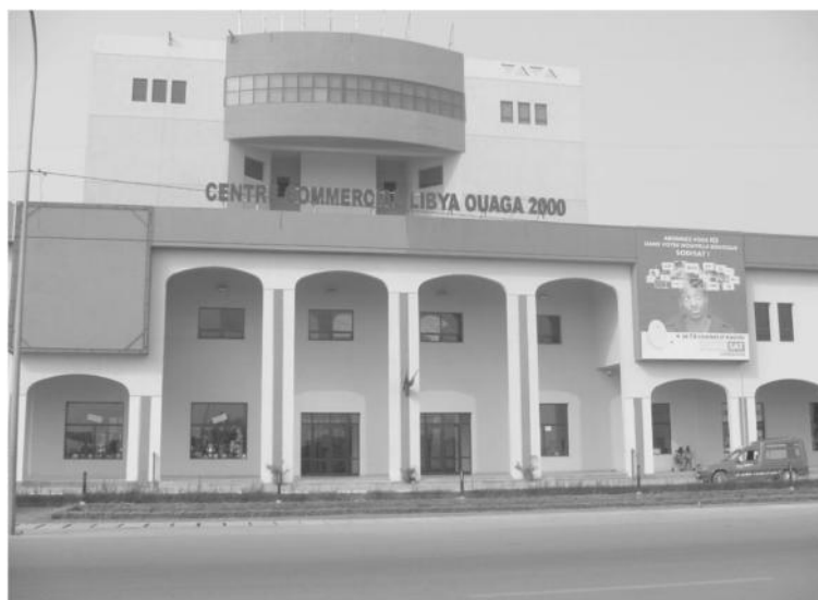
Fig. 4 - Centre commercial Libya en activité depuis 2008 à Ouaga 2000, Ouagadougou

Des programmes de logements sont venus accompagner le projet initial avec en premier lieu la construction de villas présidentielles utilisées par l'État dans le cadre de manifestations diverses puis rendues aux investisseurs privés impliqués ou vendues.