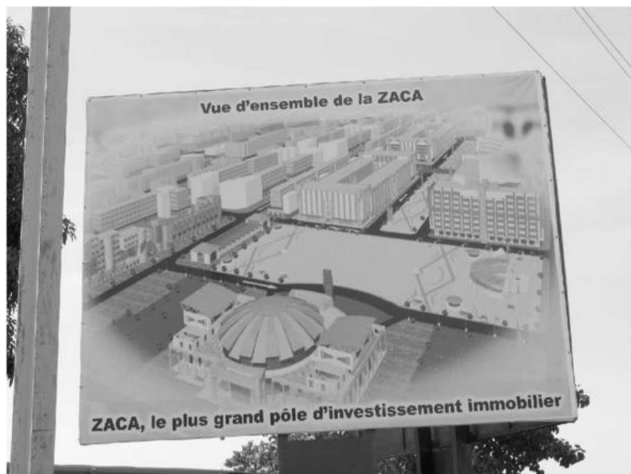
Fig. 3 - Image du projet ZACA, avec au premier plan la coupole du futur centre culturel polyvalent, Ouagadougou, (Cliché B. Bertoncello, 2007).

Localisée en centre-ville, l'opération « ZACA [6] » s'apparente à une intervention de rénovation urbaine réactivant les principes hygiénistes d'une démolition de l'existant en vue de la mise en place d'un nouveau projet à forte composante économique. Au Sud Est, le projet « Ouaga 2000 », pensé selon les modalités de création d'une ville nouvelle avec une double fonction résidentielle et politico-administrative, évolue au gré des programmations désordonnées d'équipements de prestige. Dans un contexte de décentralisation et de ressources incertaines, gouvernements local et national sont contraints de mobiliser les ressources financières émanant du secteur privé pour mettre en œuvre les actions envisagées (Bredeloup, Bertoncello, Lombard, 2008). Bien que l'État soit à l'origine de ces deux grands projets urbains, il ne peut les porter seul et développe une mission de promoteur en construisant des discours sur le bien-fondé d'une telle transformation de la capitale dans une dynamique de modernisation et de positionnement international.