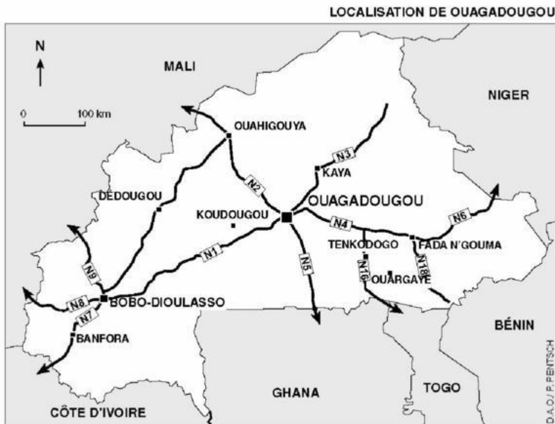
Fig. 1 - Localisation de Ouagadougou. Location of Ouagadougou.

par l'État burkinabè s'est traduite par l'opération Bayiri [2] consistant à acheminer par car depuis Abidjan les populations projetant un retour au pays. Un transit de quatre jours maximum à Ouagadougou permet alors une aide médicale et alimentaire avant une répartition des populations entre leurs différents villages d'origine. Après cette action d'assistance menée dans une phase d'urgence, un Programme d'appui à la réinsertion socio-économique des rapatriés de Côte d'Ivoire est lancé en juin 2003 par le Ministère de l'agriculture. Cette aide gouvernementale en deux temps destinée aux rapatriés n'a pas pris en compte les intentions de retour en ville et ceux qui ont opté pour ce choix ont été contraints de trouver seuls les voies de leur insertion dans le tissu économique et social existant (Bredeloup, 2006).