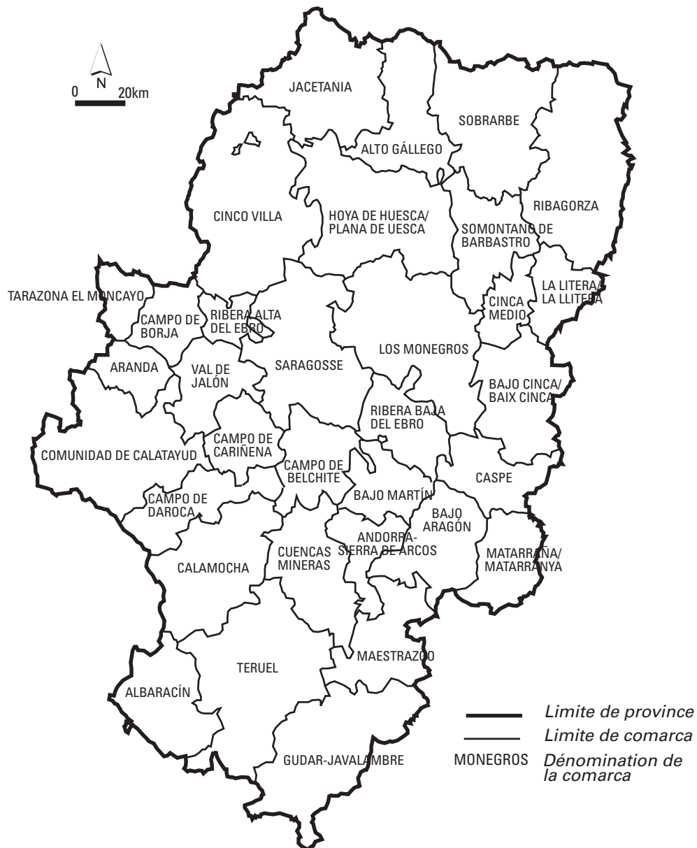
Figure 2 : Le découpage de l'Aragon en comarcas en janvier 2003 (d'après la loi 8/1996 du 2 décembre)

Bien que conçues toutes sur le même modèle, les comarcas diffèrent en fonction des compétences prises en charge, du niveau réel d'intégration souvent conditionné par l'antériorité de la coopération, de l'ambition du projet territorial (CLARIMONT, 2006b). Forme hybride mêlant collectivité locale nouvelle, intercommunalité de service et intercommunalité de projet, les comarcas se sont mises en place somme toute assez rapidement et bénéficient aujourd'hui d'une assez grande lisibilité auprès de la population. Conçues en période d'expansion économique, elles sont cependant aujourd'hui confrontées à la crise et au tarissement des finances publiques. Elles subissent les effets de restrictions budgétaires importantes (- 5 % en 2012, - 11% en