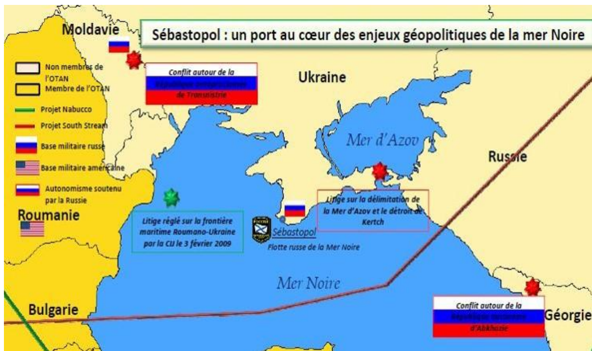
Doc. 3 L'importance géostratégique de la Crimée pour l'Ukraine et la Russie