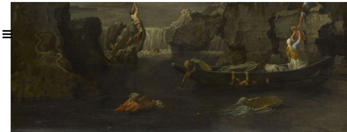
Nicolas Poussin, L'Hiver ou le Déluge