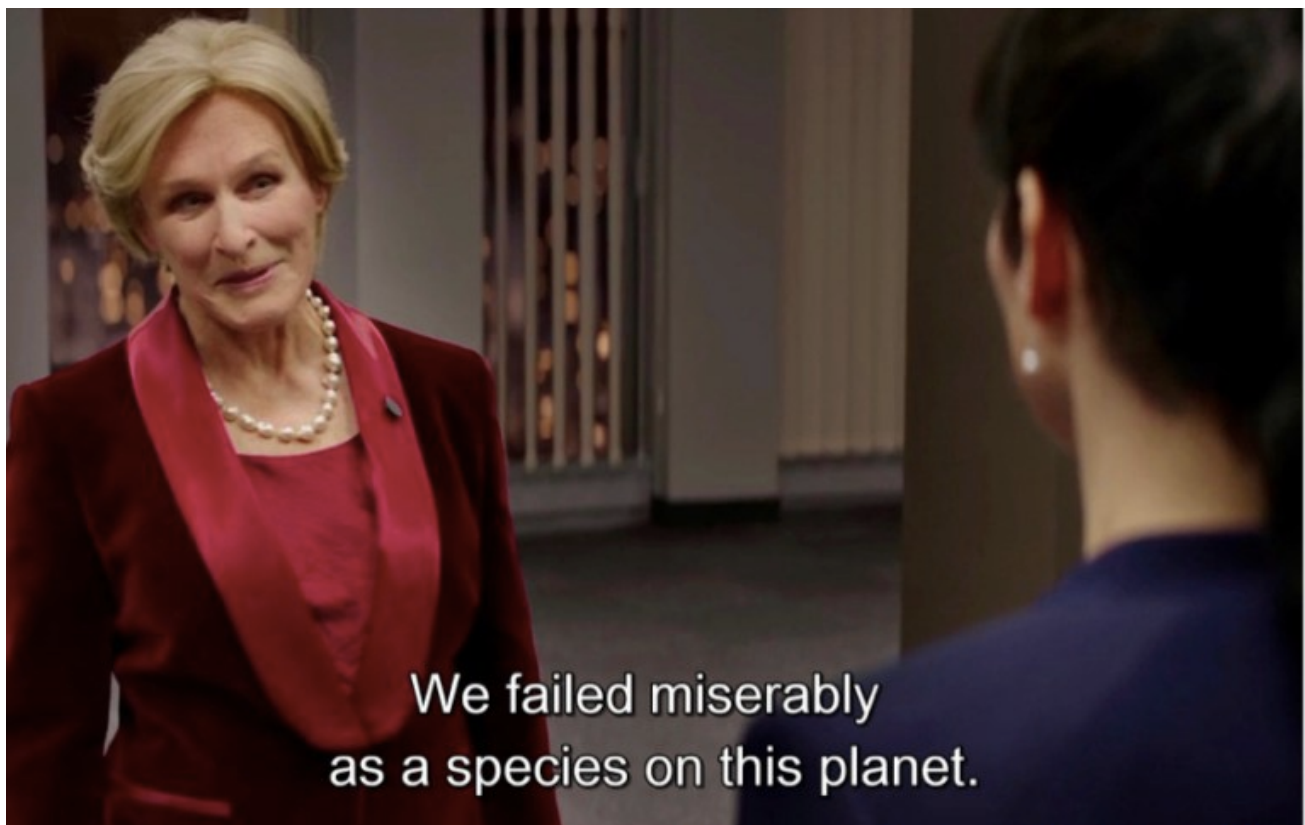
What happened to Monday (T. Wirkola, 2017)

« C e fut le réflexe de défense d'une littérature qui, se sentant menacée parce que ses techniques et ses mythes n'allaient pas lui permettre de faire face à la situation historique, se greffa des méthodes étrangères pour pouvoir remplir sa fonction dans des conjectures nouvelles. [...] Nous avons entrepris de faire une littérature des situations extrêmes. » (Jean-Paul Sartre)