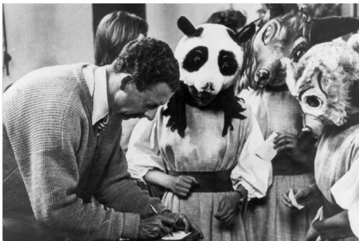
Benjamin Britten et la troupe de Noye's Fludde (1958)

que des insectes, que l'homme est le rêve impossible des cafards et des cloportes et qu'ils se réveilleraient vermine comme tout le monde. » Face à ce défi absolu et ce cauchemar d'une entomologie humaine qui rappelle autant La Métamorphose de Kafka que le « tribunal des Crabes » des Séquestrés d'Altona , la victime devait avoir la force de puiser « à l'intérieur de l'humain » et « décider souverainement s'il y aurait dedans quelque chose de plus que le règne animal » (265). L'extase de la liberté sartrienne se donne comme le seul moyen offert à l'homme pour survivre à l'éclatement de la sphère métaphysique et ce moyen consiste à s'extirper de la sphère de l'animalité en sacrifiant sa vie de vivant animal pour se convertir à l'humanité. Ce credo du torturé crée par sa confession de foi l'existence de ce qu'il confesse : credo in unum hominem – cet « homme unique » qui est lui-même dans l'acte de se créer libre. Dans Situation de l'écrivain en 1947 , la crise de l'humanisme se résout ainsi par un transfert de la geste hominisante dans le geste absolu d'une liberté jouant l'humanité dans l'existence de chaque homme. L'hominisation n'est pas cet événement lointain de notre phylogénèse, qui a produit homo sapiens ; l'hominisation est le choix actuel que refait chacun de nous quand il décide de « se faire homme » en s'arrachant au « règne animal ».