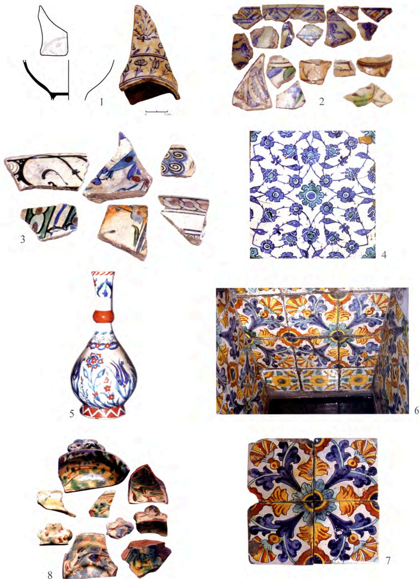
Pl. I 1, Rade de Villefranche ; 2, Marseille, Abbaye Saint-Victor ; 3, Marseille, Fort Saint-Jean et place de la Bourse ; 4, Marseille, musée Grobet Labadie ; 5, coll. part. ; 6 et 7, Istanbul, Topkapi Saray ; 8, Algérie, La Calle.