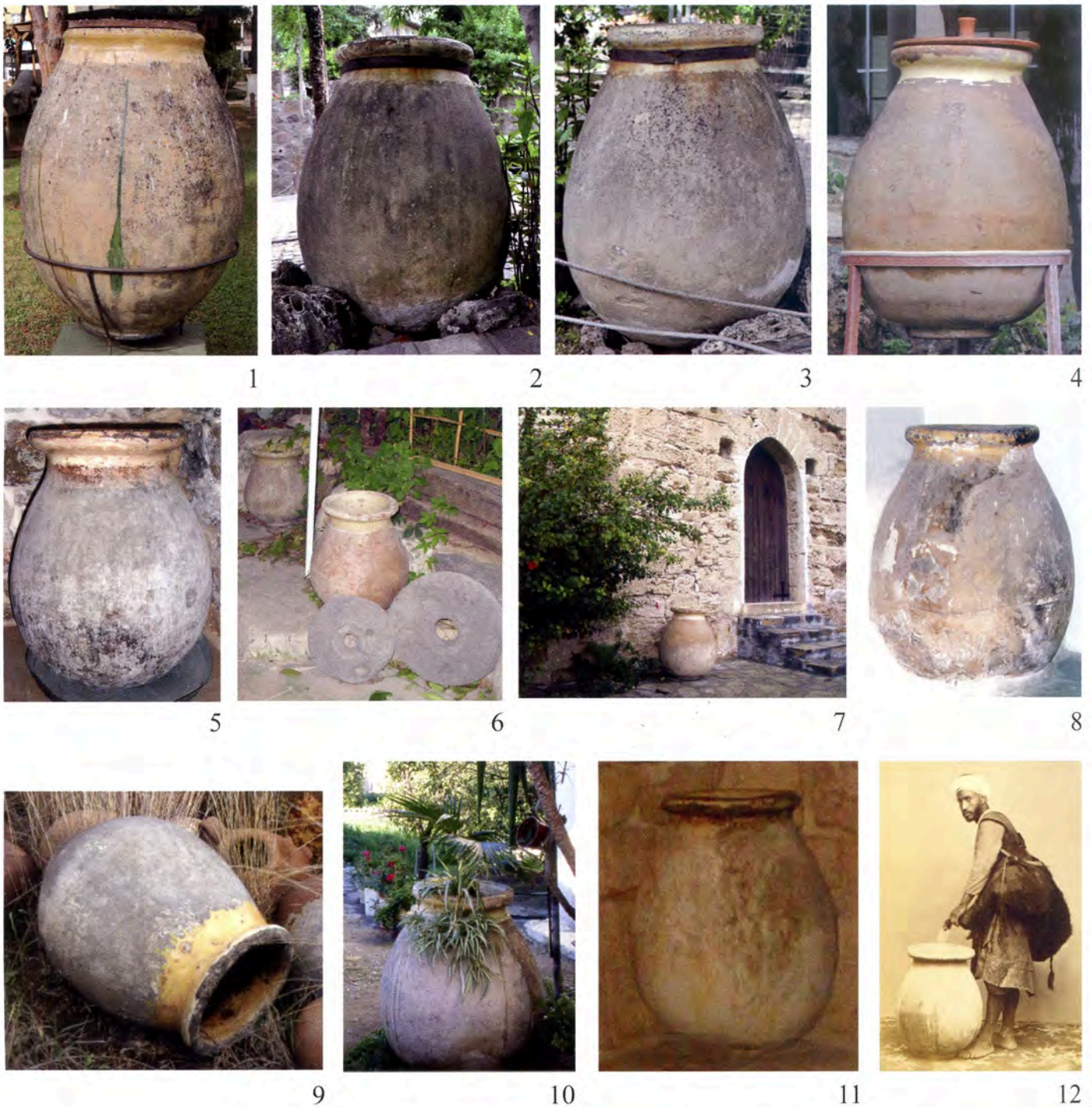
Pl. VII 1, Turquie, musée d'Alanya ; 2-3, musée d'Izmir ; 4, musée d'Antalya ; 5, Syrie, couvent Saint-Georges ; 6, Syrie, moulin à Safita ; 7, Chypre, Kyrenia ; 8, Nicosie, Hadji Georjakis ; 9, Chypre, Mosphiloti ; 10, Chypre, Dali ; 11, Liban, Saïda, musée du savon ; 12, Egypte, Alexandrie, porteur d'eau.