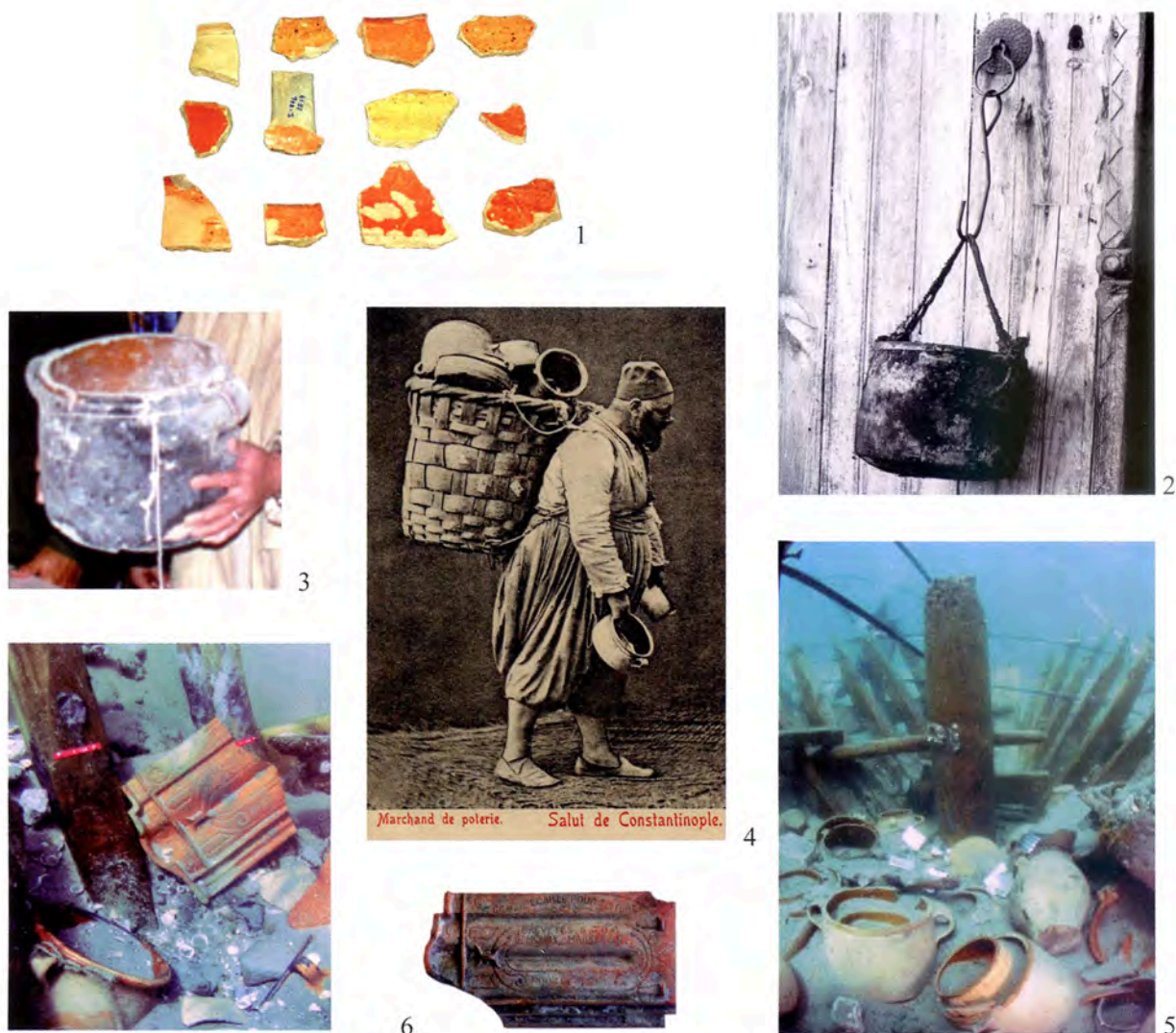
Pl. VIII 1, Chypre, Potamia survey; 2, Chypre, Alona; 3, Egypte, Alexandrie; 4, Istanbul colporteur; 5-6, Haïfa, épave Dor C.