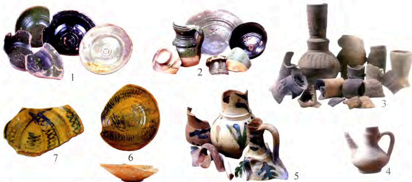
Pl. III 1-7, Marseille, Port de Pomègues.

communes » provenant du Levant (308 000 livres/poids) soit 2,42 % du total et un peu plus du double à la sortie (634 395 livres/poids) soit 5,72 % des sorties. Face à ces données chiffrées, aussi incomplètes et lacunaires puissent-elles être, nous avons somme toute peu d'indices matériels à présenter. Deux contextes terrestres du début du XVIII e s. ont livré deux objets (Abel, 2014 : 232, 233 fig. 196 ; Amouric, Richez, Vallauri, 1999 : 160, fig. 290). L'un provient d'une fouille marseillaise (Pl. II, 1) ; le second est d'autant plus intéressant qu'il est rural et forestier. Il s'agit d'un corps d' ibrik de Küta-hya, provenant de la verrerie de Roquefeuille, en Provence centrale (Pl. II, 2). Mais il faut savoir que ces fabriques étaient possédées par une noblesse industrielle particulière et source souvent de notables profits. Il s'agit donc ici d'un contexte « privilégié ».