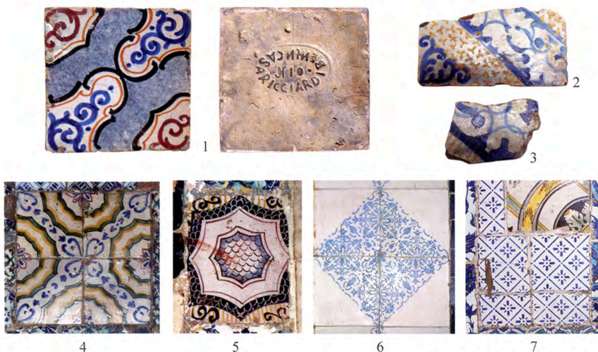
Pl. IX 1, Istanbul, Topkapi Saray, réserve archéologique; 2, 3 Israël, découverte subaquatique; 4-6, Alexandrie, mosquée Shorbaghi; 7, Istanbul, mosquée Rüstem Pacha.