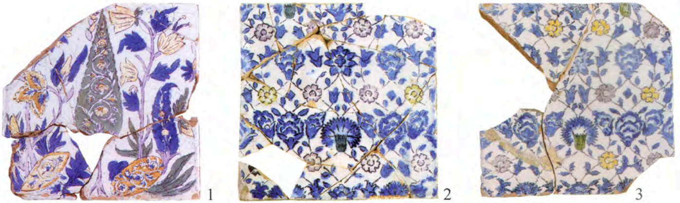
Pl. VI 1-3, Marseille, dépôt archéologique.