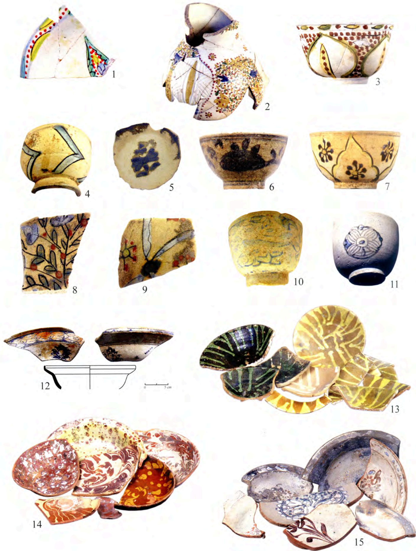
Pl. II 1, Marseille, Place Bargemon ; 2, Pourrières, Verrerie de Roquefeuille ; 3-11, Marseille, Port de Pomègues, 12, Rade de Villefranche, palais de la Marine, 13-15, Marseille, Port de Pomègues.