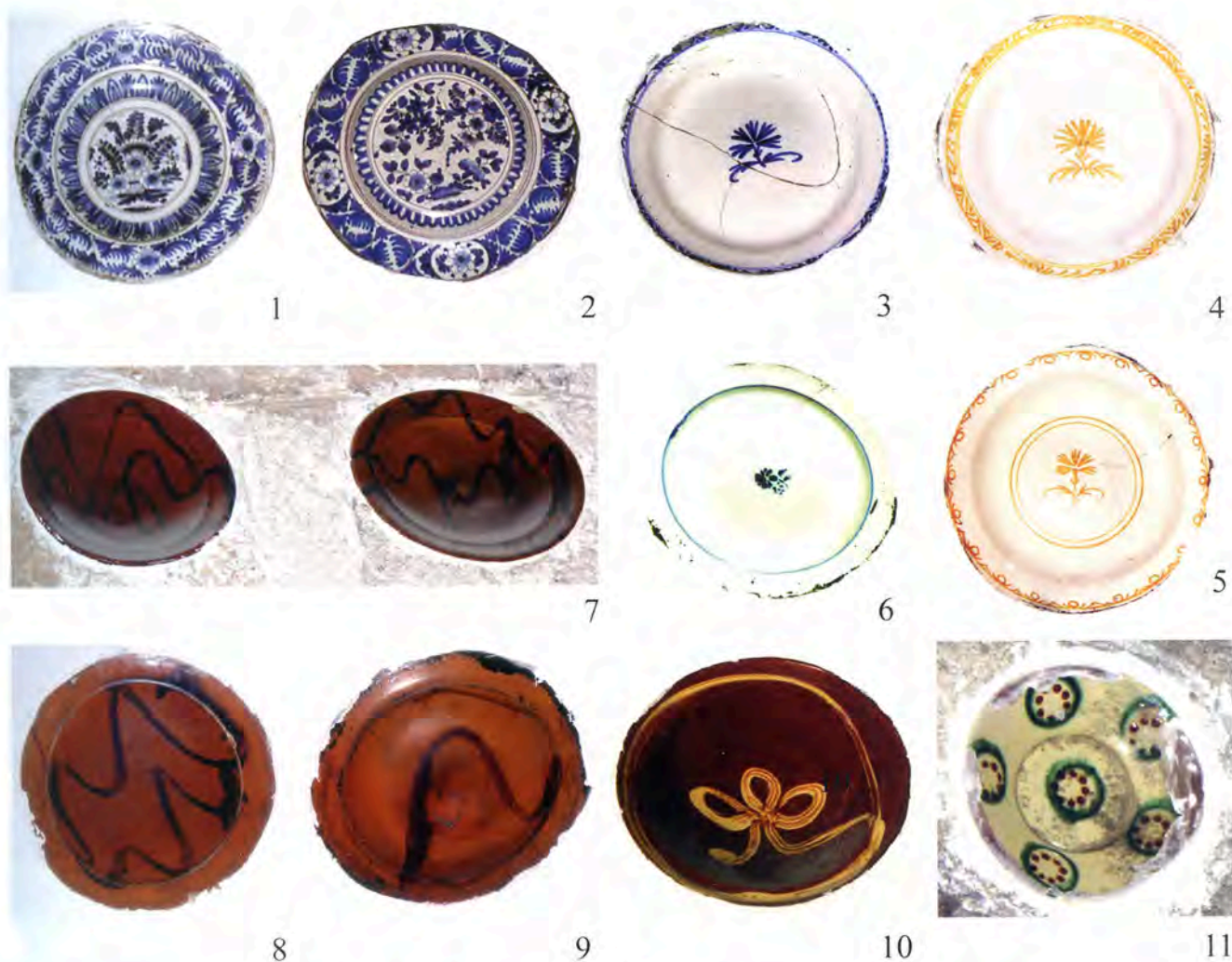
Pl. V Chypre, Nicosie, 1-6, 8-9 ; églises de Kaïmakli ; 7, 10, 11 Paralimni.

Le Sérail n'est pas le seul endroit où l'on ait eu recours à ces revêtements émaillés d'une esthétique très différente du goût ottoman. On en retrouve également la trace, à la Mosquée d'Eyup, toujours à Istanbul,