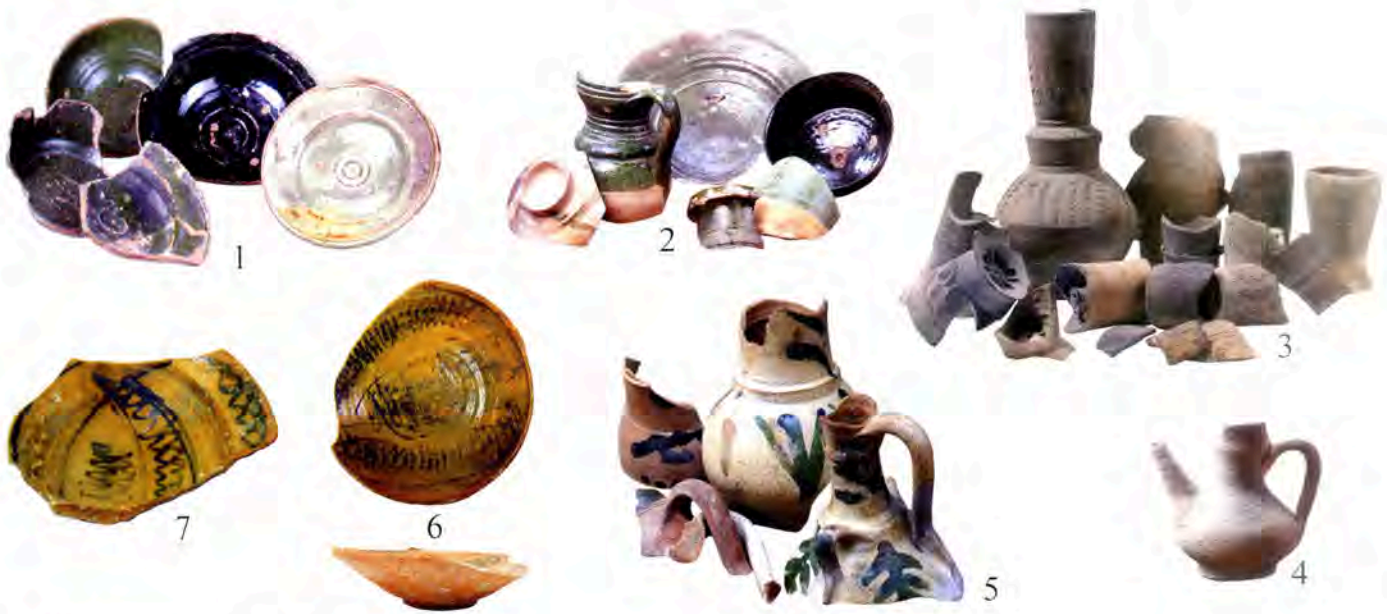
Pl. III 1-7, Marseille, Port de Pomègues.

communes » provenant du Levant (308 000 livres/poids) soit 2,42 % du total et un peu plus du double à la sortie (634 395 livres/poids) soit 5,72 % des sorties. Face à ces données chiffrées, aussi incomplètes et lacunaires puissent-elles être, nous avons somme toute peu d'indices matériels à présenter. Deux contextes terrestres du début du XVIII e s. ont livré deux objets (Abel, 2014 : 232, 233 fig. 196 ; Amouric, Richez, Vallauri, 1999 : 160, fig. 290). L'un provient d'une fouille marseillaise (Pl. II, 1) ; le second est d'autant plus intéressant qu'il est rural et forestier. Il s'agit d'un corps d' ibrik de Küta-hya, provenant de la verrerie de Roquefeuille, en Provence centrale (Pl. II, 2). Mais il faut savoir que ces fabriques étaient possédées par une noblesse industrielle particulière et source souvent de notables profits. Il s'agit donc ici d'un contexte « privilégié ».