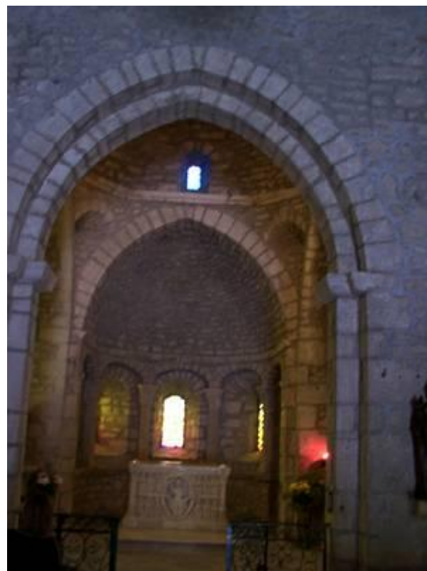
Abside et autel de l'église d'Avenas