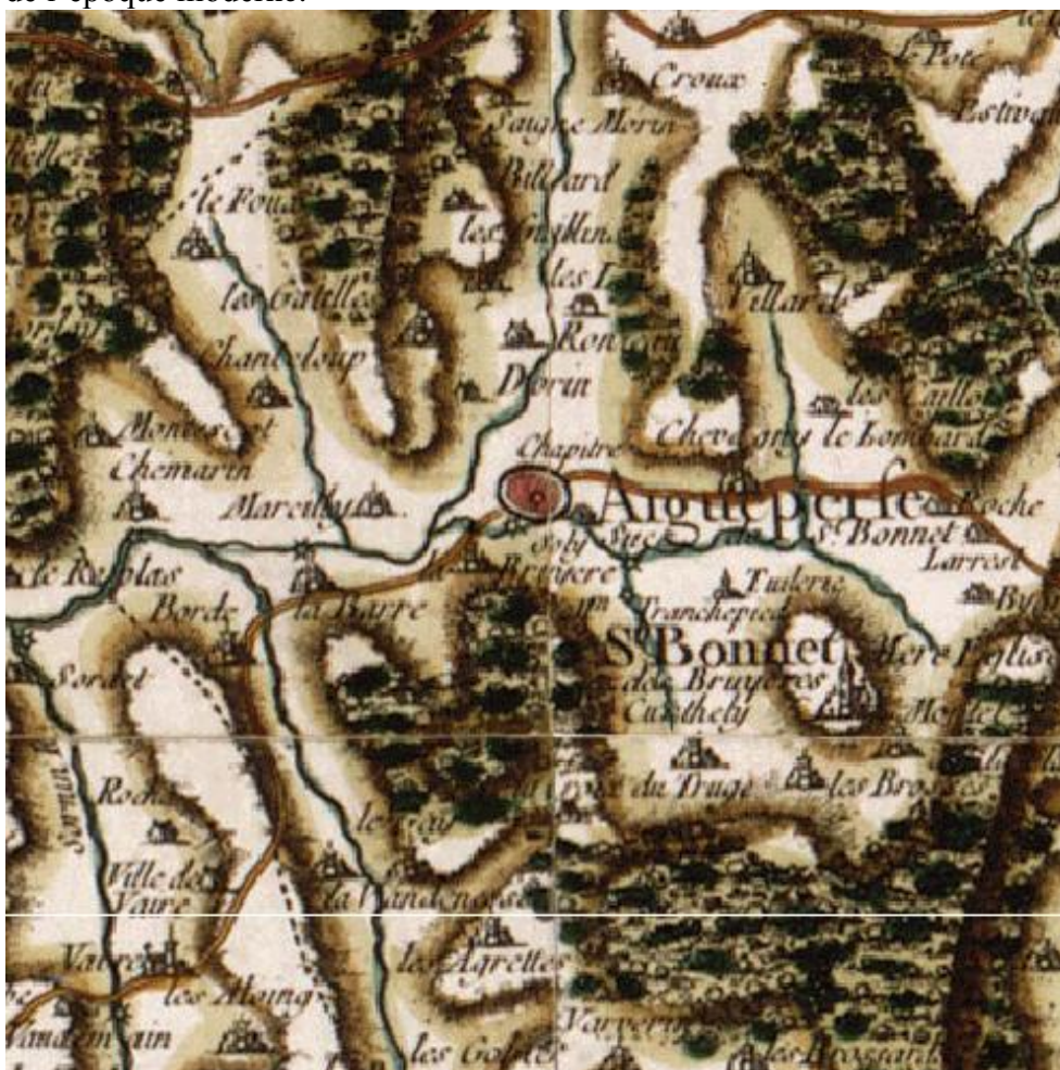
Carte de Cassini.

Les sources sont très lacunaires. Des statuts copiés à la fin du XVe siècle 64 ont été conservés mais il faut déplorer la disparition des archives médiévales en grande partie en 1562 mais aussi pendant la période révolutionnaire. Quelques fragments de registres de délibérations capitulaires apportent ponctuellement une aide mais il faut se contenter des copies de la charte d'érection, des statuts du XVe siècle et des procès-verbaux de visites pastorales de l'époque moderne.