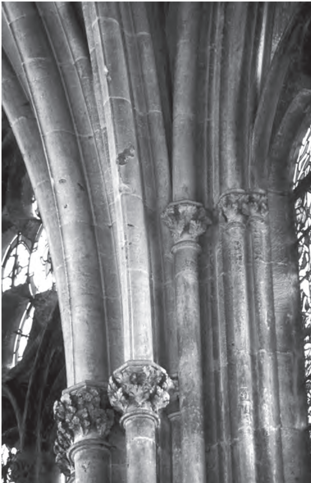
Fig. 1. Rouen, cathédrale, chapelle axiale, pile engagée, chapiteaux et départ des nervures.

une rainure séparative (en gris). La plinthe est à son tour surmontée d'une base moulurée atrophiée, dépourvue de scotie (en rouge) ; le tore inférieur, bien plus grand que le tore supérieur, débordé légèrement de la surface de la plinthe. Ces trois éléments présentent une section circulaire pour la base moulurée et polygonale – hexagonale ou octogonale – pour la plinthe et le socle. L'emploi des deux variantes est régi par des conventions rigoureusement observées. Les plinthes et socles octogonaux, en effet, sont toujours associés à une colonnette recevant une nervure à section circulaire. Les plinthes et socles hexagonaux, en revanche, sont réservés aux colonnettes soutenant une nervure à filet 2 (fig. 1 et 2).