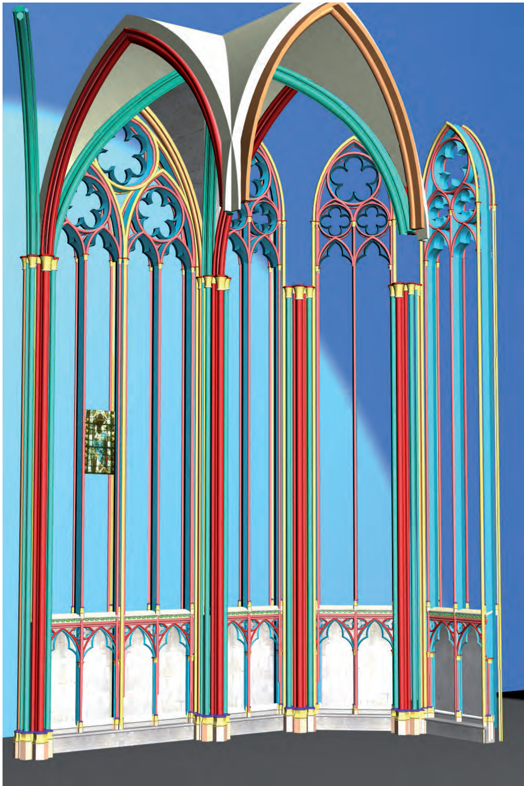
Fig. 4. Rouen, cathédrale, chapelle axiale, modèle partiel (sans échelle) avec dissociation par coloration des différentes arcades structurant l'édifice (arc doubleau en rouge, nervures diagonales en vert, arc formeret en orange, etc.) (dessin : Markus Schlicht).