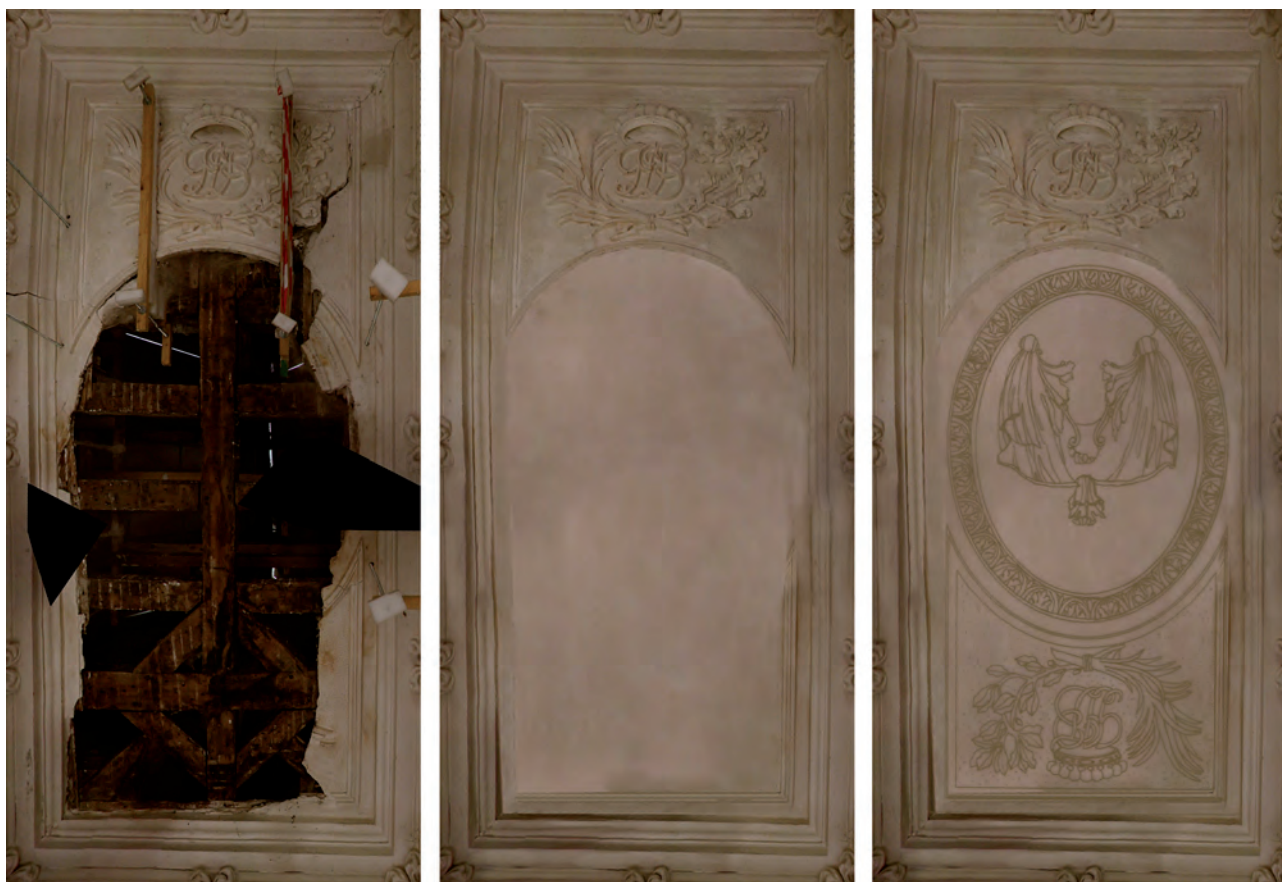
Fig. 3. Restauration virtuelle.