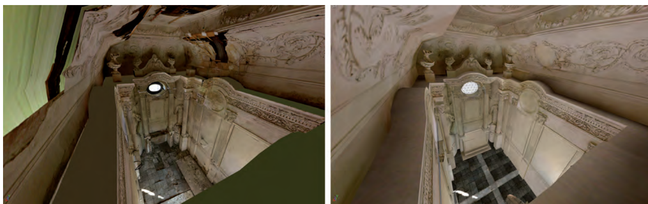
Fig. 4. Modèle 3D texturé restauré virtuellement.