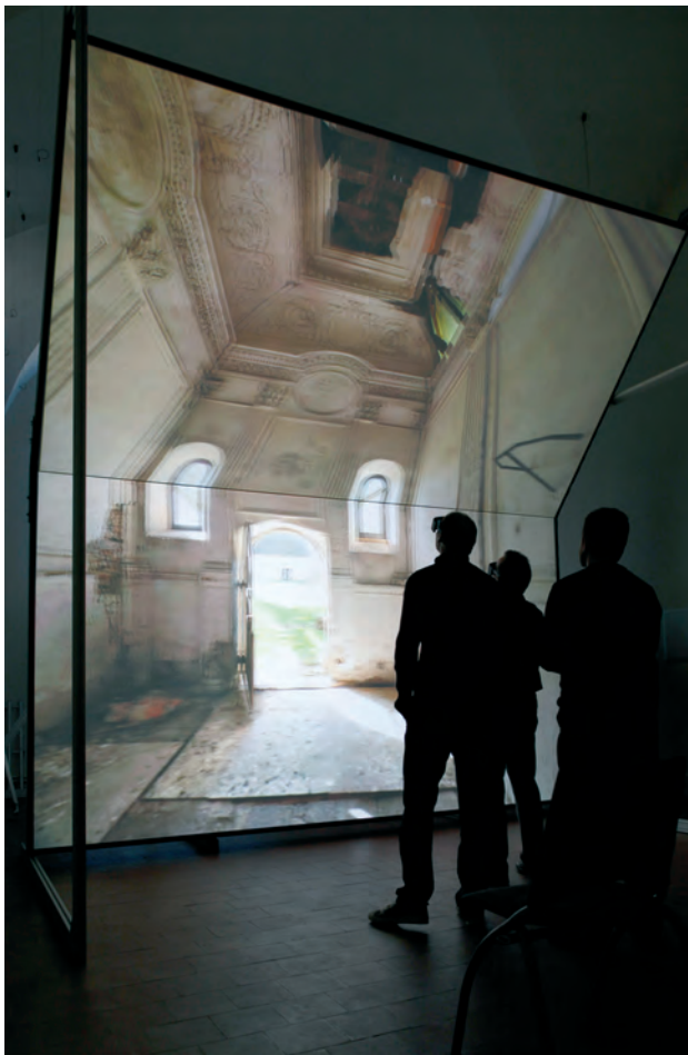
Fig. 5. Visualisation à l'échelle 1 dans un dispositif immersif.

modèle. En effet, sans retoucher au modèle, les moulures endommagées et autres trous dans le plafond peuvent être facilement restaurés sur les textures dans un logiciel de retouche d'image comme Photoshop.