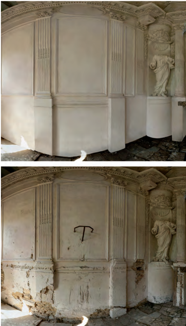
Fig. 2. Travail de nettoyage de textures.

ayant des avantages, et qu'il convient de distinguer en fonction de nos besoins. En dehors des relevés manuels, on peut distinguer deux familles de technologies d'acquisition, l'une destinée à l'étude géométrique précise (souvent, à base de relevés lasers), et l'autre d'avantage destinée à avoir un aperçu rapide et interactif de notre objet (souvent, à base de photos).