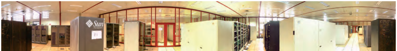
Centre de Calcul d'IN2P3 : vue de la salle des clusters de PC où sont installés les serveurs de données du Centre de Ressources Numérique 3D du TGE Adonis ( Archéovision), © ccIN2P3.

Les investissements en temps et en financement pour la réalisation de scènes 3D justifient pleinement la mise en place de services mutualisés de sauvegarde des données numériques 3D en SHS. Mais le plus important est que ces données 3D constituent des sources documentaires qui doivent être impérativement documentées, protégées et pérennisées pour la continuité de la recherche sur le patrimoine archéologique.