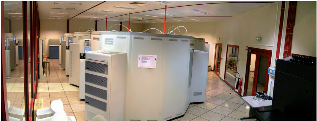
Centre de Calcul d'IN2P3 : vue des armoires de stockage des sauvegardes des scènes 3D du Conservatoire National des Données Numériques 3D pour le patrimoine, © ccIN2P3.