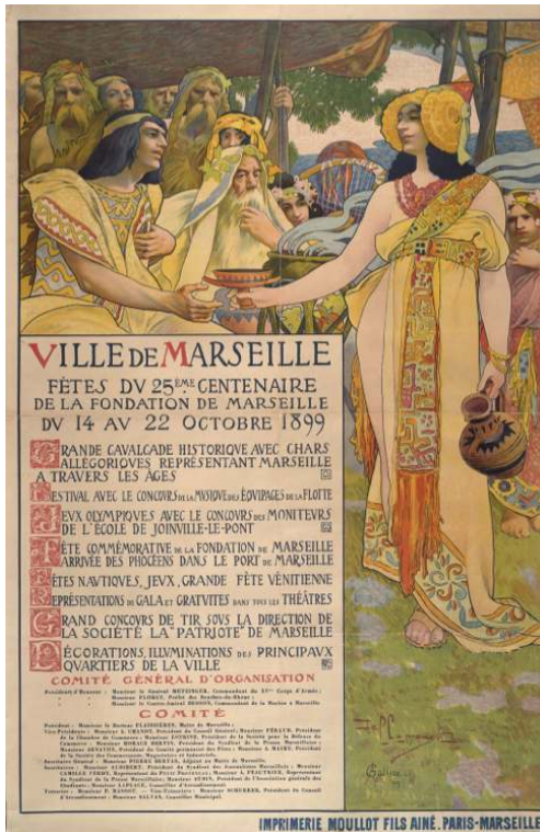
Affiche de David Dellepiane pour les fêtes du 25 ème anniversaire de la fondation de Marseille, 1899.