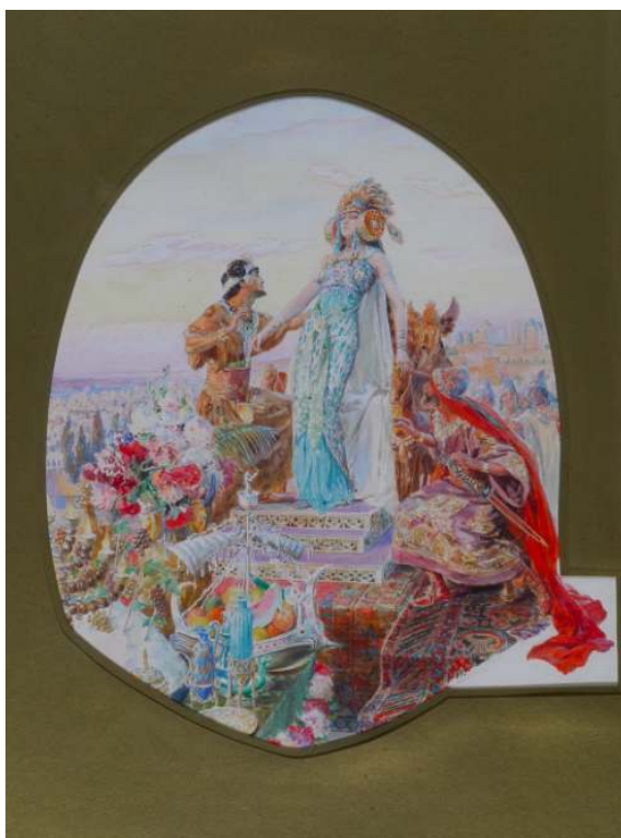
Georges-Antoine Rochegrosse, illustration de l'édition de 1900 de Salammbô , Gustave Flaubert, Ferroud Editeur, coll. particulière.