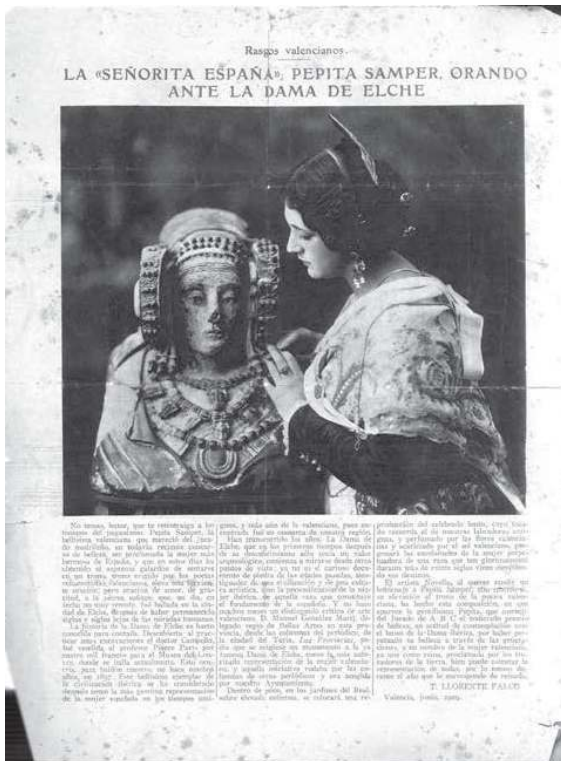
« La Miss Espagne, Pepita Samper, priant devant la Dame d'Elche », Journal ABC, 23 juin 1929, p. 19.