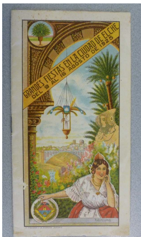
Couverture du programme des fêtes patronales d'Elche de 1925, Archivo Histórico Municipal de Elche.