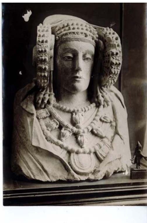
Dame d'Elche. Photographie prise en 1906 au Louvre.