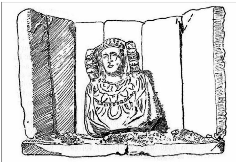
Dessin d'Alejandro Ramos Folqués publié dans La Dama de Elche. Nuevas aportaciones a su estudio , Madrid, Gráficas Uguinos, 1945, p. 10.