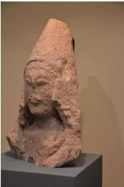
Cerro de los Santos (Albacete): dame portant une mitre, Musée d'Albacete.