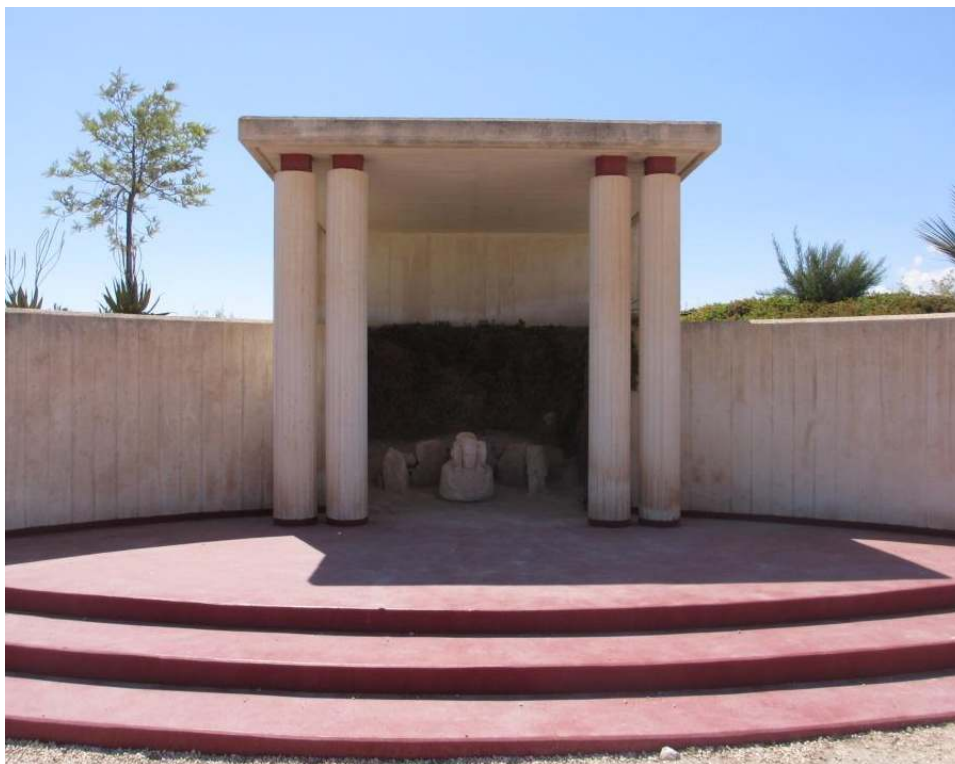
L'édicule bâti en 1997 à l'Alcudia, sur l'endroit supposé de la découverte de la Dame.