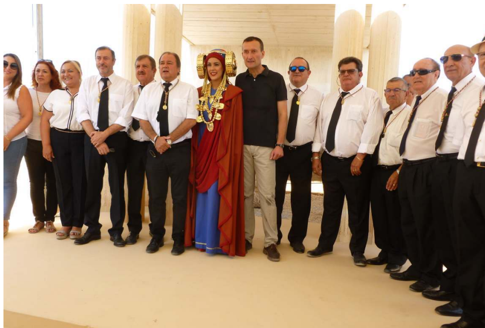
La « Dame vivante », le maire d'Elche et le comité directeur de la Real Orden de la Dama de Elche lors de la commémoration de la découverte du buste le 4 août 2018.