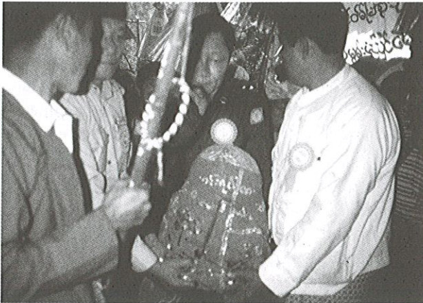
Fig. 2. Transport par un membre de la junte de l'une des quatre images du karaweik vers un hall d'accueil (Inlé, 1994)

Vice-Chairman of the State Law and Order Restoration Council Deputy Commander-in-Chief of Defence Services Commander-in-Chief (Army) General Maung Aye, accompanied by Secretary-1 of the State Law and Order Restoration Council Lt-Gen Khin Nyunt [...], ministers, senior Tatmadaw officers, local populace and pilgrims throughout the nation paid homage to the Buddha images being conveyed on board the float back to the pagoda [...]