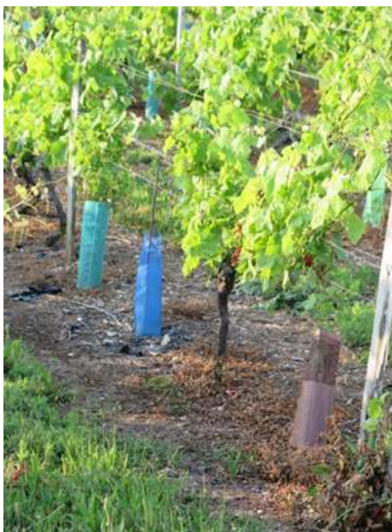
Figure 3. Manchons posés autour des pieds de vigne pour se protéger des lapins, Sainte-Marie-de-Ré