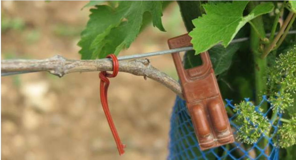
Figure 2. Capsules de phéromones installées sur les ceps de vigne dans le cadre de la confusion sexuelle

globalité. Cela pourrait constituer un terreau favorable à des pratiques adaptatives plus larges.