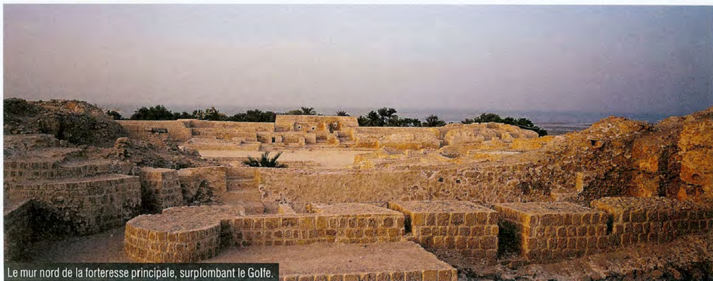
Le mur nord de la forteresse principale, surplombant le Golfe.

comme exemple de l'architecture maritime ancienne, et le chenal adjacent démontre l'extraordinaire importance de cette ville sur les routes du commerce maritime de l'Antiquité. Qal'at al-Bahreïn, considéré comme la capitale de l'ancien Empire de Dilmun et le premier port de cette civilisation depuis longtemps disparue, était le centre d'activités commerciales assurant le lien entre l'agriculture traditionnelle (représentée par