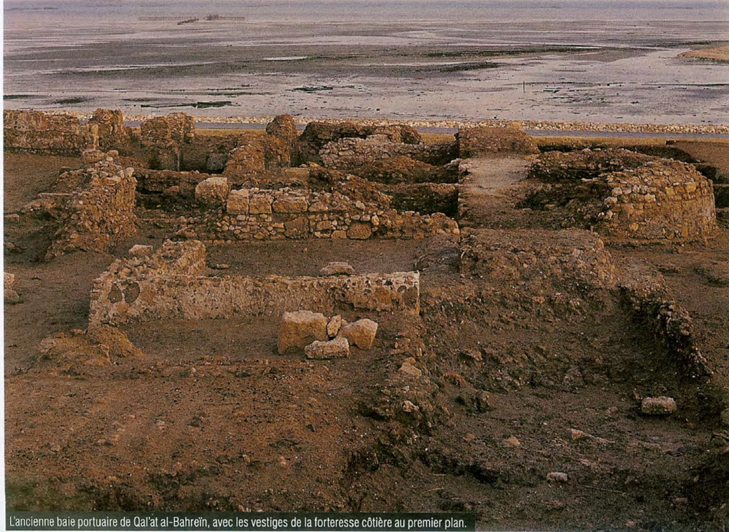
L'ancienne baie portuaire de Qal'at al-Bahreïn, avec les vestiges de la forteresse côtière au premier plan.