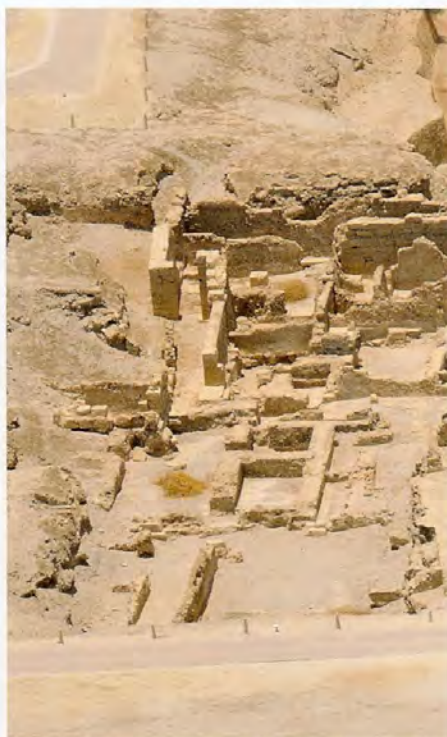
Les constructions tardives de Dilmun à Qal'at al-Bahreïn, environ 800 av. J.-C.

Véritable carrefour d'échanges économiques et culturels, Qal'at al-Bahreïn exerçait un rôle commercial et politique très actif dans toute la région. La rencontre de différentes cultures qui s'en est suivie est illustrée par l'architecture monumentale et défensive successive du site, comprenant une forteresse mise au jour sur la côte, dont la construction remonte environ au III e siècle apr. J.-C., et la grande forteresse édifée sur le tell au XVI e siècle et qui a donné son nom au site « Qal'at al-Bahreïn ». De même, le tissu urbain merveilleusement préservé de l'ancienne capitale et les découvertes variées d'une valeur exceptionnelle témoignent d'un mélange de langues, de cultures et de croyances. À titre d'exemple,