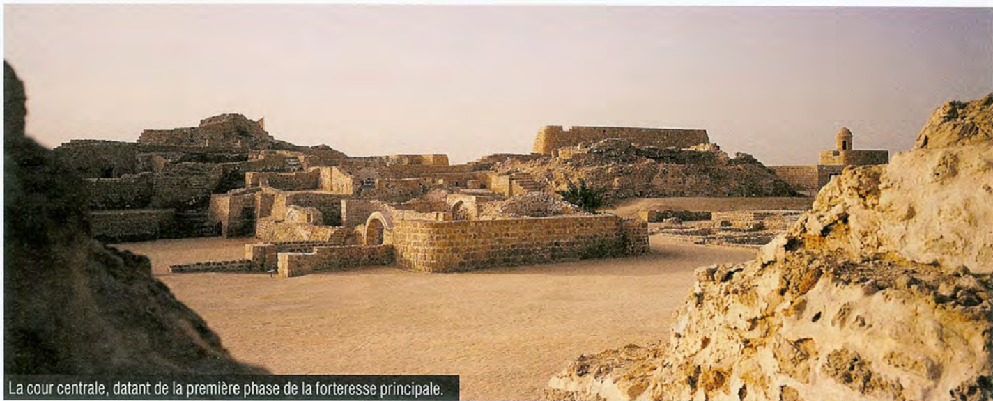
La cour centrale, datant de la première phase de la forteresse principale.