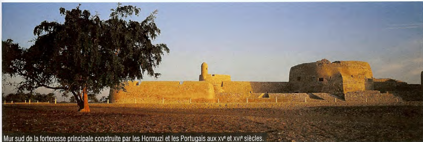
Mur sud de la forteresse principale construite par les Hormuzi et les Portugais aux XV e et XVI e siècles.