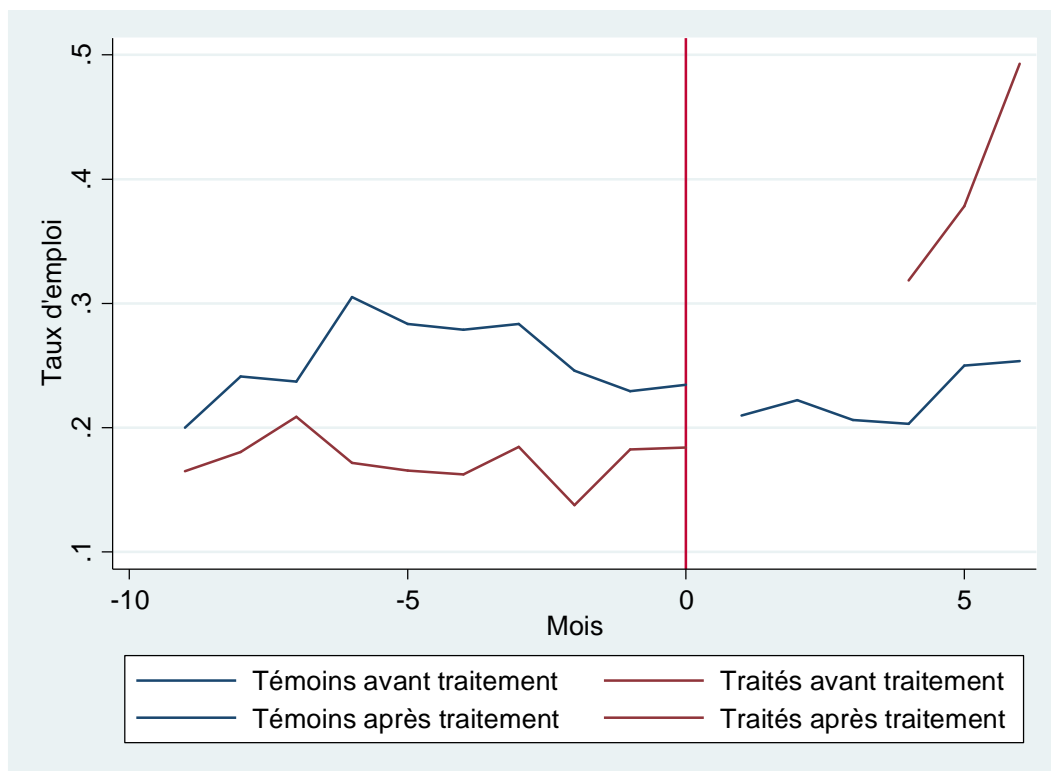
Graphique 2 : Evolution du taux d'emploi pour les individus du groupe traité et du groupe témoin qui sont présents sur les deux périodes

Il est toujours préférable d'utiliser la dimension longitudinale des données pour mieux contrôler de l'hétérogénéité individuelle, en utilisant des données répétées pour chaque individu. Les effets moyens au niveau des groupes sont remplacés par des effets fixes individuels :