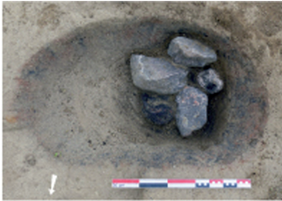
Fig. 2 — Vue de la fosse FY1126 en fin de fouille

La fosse, excavée peu profondément dans le substrat marneux, semble avoir comporté deux creusements, même si le remplissage homogène indique un comblement rapide et simultané. Les trois monnaies en argent ont été retrouvées dans ce comblement, accompagnées de quelques cendres et charbons de bois indiquant la présence d'un foyer d'ampleur limitée, à proximité immédiate de la fosse dont le comblement pourrait constituer la vidange.