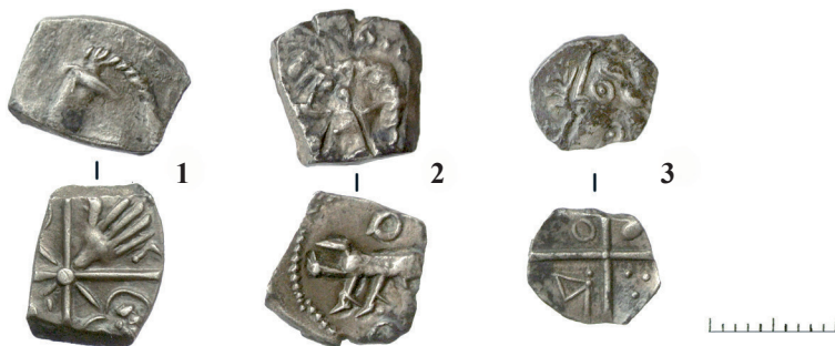
Fig. 3 — Monnaies du dépôt de FY1126 (échelle 1,5x 1)