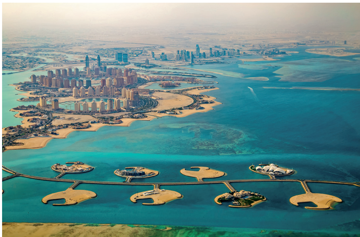
Photo ci-dessus : Vue aérienne de Doha, capitale du Qatar. Si l'émirat est sous le coup d'un blocus terrestre depuis bientôt un an, les quotidiens saoudiens se font actuellement l'écho d'une idée consistant à transformer la presqu'île du Qatar en une île, en creusant un canal tout le long des 60 km de la frontière arabo-qatarienne pour détacher le Qatar de la terre ferme saoudienne.