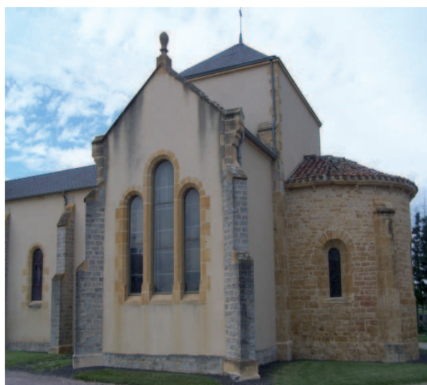
III. n° 4 – Église d'Avrilly. Transept et abside vus du sud