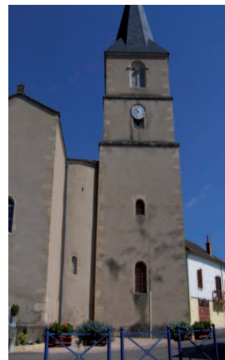
Ill. n° 7 – Eglise de Mussy. Le clocher et l'abside vus du sud

Dans les exemples examinés jusqu'ici, la nef est détruite pour être remplacée par une nef nouvelle ; le plan est transformé, certes, mais les lignes directrices de la structure d'origine restent