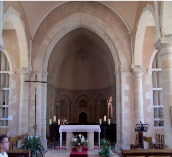
Ill. n° 6 – Eglise de Mussy. Le chœur

été détruits, mais pas les contreforts qui l'épaulaient à chaque extrémité. Les murs est et ouest des chapelles sont élevés dans le prolongement de ces contreforts. Nous émettons l'hypothèse que les chapelles sont contemporaines de la nef à trois vaisseaux. Dans le cadastre napoléonien, nous voyons une chapelle au sud de la travée de chœur, mais ce n'est pas la chapelle actuelle ; il s'agit plus probablement d'une chapelle décrite lors des visites pastorales de 1705 et 1746 : « fort peu élevée », dont le niveau de sol se trouvait à environ 0,60 m au-dessous de celui de la travée du chœur, communiquant par « une porte trop basse revêtue d'un boisage grossièrement fait », en résumé une chapelle « très peu décente n'étant susceptible d'aucune décoration » 18 . Nous ne savons pas quand cette chapelle fut bâtie, mais il est très probable qu'elle n'appartenait pas à l'édifice d'origine. La travée de chœur romane devait être percée d'une baie dans chacun de ses murs latéraux ainsi que le signale le visiteur de 1746.