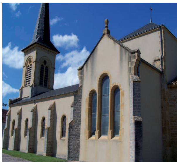
III. n° 3 – Église d'Avrilly. Nef et transept vus du sud

la nef et un état III, celui de la seconde reconstruction de 1883-1885. L'état II ne nous est connu que par les écrits de Moreau, qui indique que la nef actuelle a les mêmes dimensions que celle de l'état II, qui ne fut donc pas détruite parce que trop petite, mais parce qu'elle présentait d'importants défauts de conception : manque d'ouvertures, important dévers des murs, plafond délabré. Nous ne connaissons pas la date de sa construction mais nous savons que l'église avait été très endommagée durant la Révolution. Des archives du début du XIX e s. signalent qu'elle est « entièrement détruite par le fait révolutionnaire », « déparée, déplafonnée, réduite à servir d'écurie » 7 . Un document de 1810 indique qu'après avoir racheté l'édifice, les habitants l'ont « réparé, replafonné,