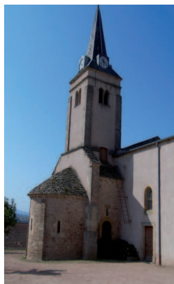
Ill. n° 8 – Eglise de Trivy. Chevet de l'église romane

L'église actuelle a son chevet tourné en direction du sud. Elle possède une nef ouvrant sur une travée de chœur terminée par une abside. À l'est du chœur se trouve une chapelle composée d'une abside et d'une travée droite portant la tour de clocher. Cette chapelle est en réalité le chevet de l'église romane primitive. L'arcade séparant l'actuelle travée de chœur de la chapelle romane est l'arc triomphal roman, c'est-à-dire l'arcade qui séparait la travée de chœur romane de la nef aujourd'hui détruite. C'est probablement vers la fin du XIX e s. que la nef fut démolie et la nouvelle église construite suivant un axe perpendiculaire à l'ancienne. Le dossier de la reconstruction a disparu mais la translation du cimetière, en 1894, fournit un indice de datation 22 . L'architecte du XIX e s. qui eut à concevoir une église plus grande ne put concilier cette exigence et l'étroitesse du chevet roman, si bien qu'il dessina un édifice nouveau. Mais il ne put, manifestement, se résoudre à détruire l'abside romane dont le fond est orné d'une arcature portée par des colonnettes à chapiteaux sculptés. C'est peut-être pour sa valeur artistique, ou par souci d'économie, qu'il conserva également la travée de chœur et son clocher. Un cas assez similaire s'était déjà rencontré à Chambilly, dans les années 1850 : André Berthier avait édifié une nouvelle église immédiatement au sud