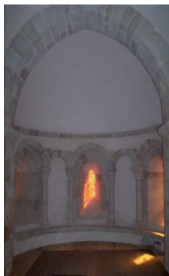
Ill. n° 9 – Eglise de Trivy. Abside romane

de l'ancienne, ce qui lui avait permis de conserver la travée de chœur et le clocher romans en raison de leur « intérêt du point de vue de l'art » 23 .