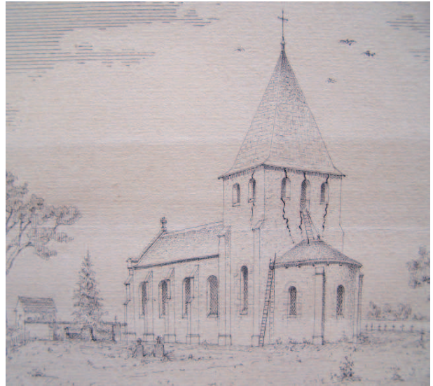
III. n° 5 – Eglise d'Avrilly. Dessin de L. Tourteau, 1895

Nous sommes donc aujourd'hui en présence d'un état IV, dû à l'architecte L. Tourteau, de Moulins 11 . Les travaux se déroulèrent entre 1896