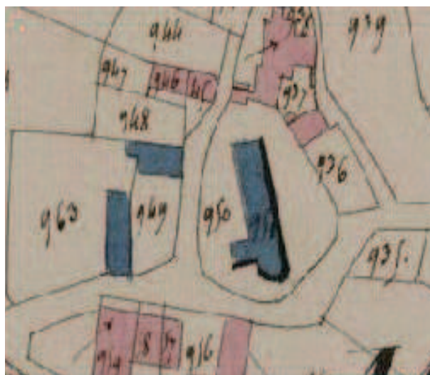
Fig. n° 2 – Église de Mussy. Plan cadastral de 1829

Les deux chapelles qui encadrent actuellement la travée du chœur sont de construction tardive. Les murs nord et sud de la travée romane ont