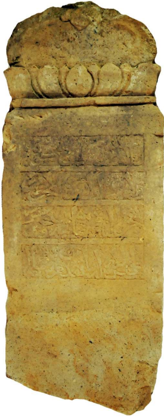
Stèle de Pananggahan (2014)