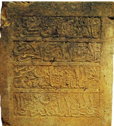
Inscription de la stèle de Pananggahan