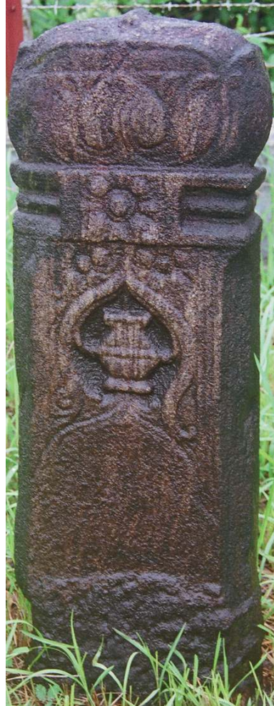
Stèle sud, tombe TA19, Cimetière de Tuan Ambar