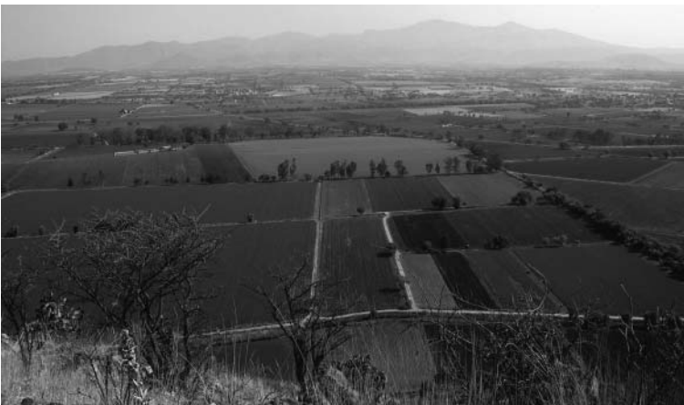
Foto 1 - Vista hacia los llanos de la zona tapón, desde el cerro El Chivo, sitio prehispánico de Acámbaro.