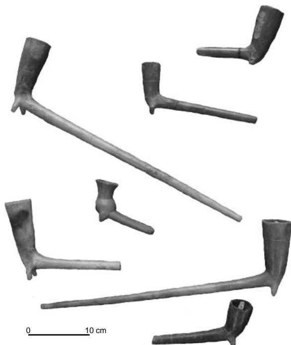
Foto 3 - Colección de pipas con un largo mango cilíndrico y recto, procedentes de Acámbaro y conservadas en el museo de esta ciudad.