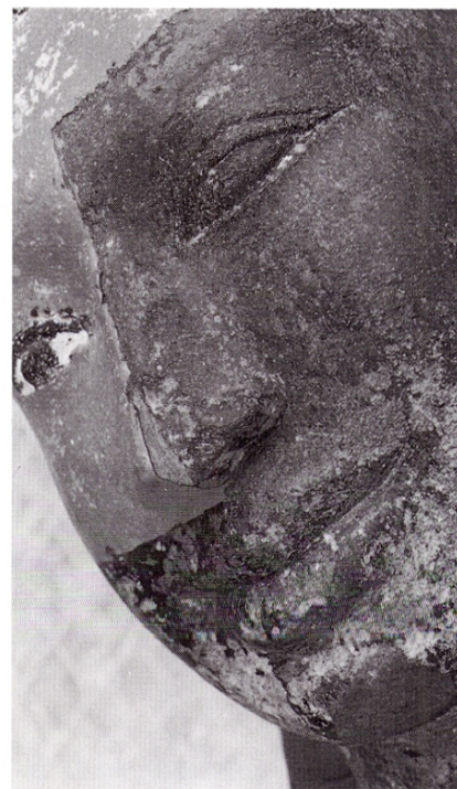
Fig. 4 La tête au cours de la deuxième partie de la restauration. La partie droite du visage porte encore des surmodelages (nez) et l'épaisse couche d'enduit et de laque [phase III]

Les phases I et II sont fines : moins d'1/2 mm. La phase III est beaucoup plus épaisse : de 3 mm à plus d'1 cm. Sur les parties remodelées, un mortier s'intercale entre les phases II et III. a : pierre (grès gris vert) b : enduit noir c : laque rouge d : dorure e : peinture dorée synthétique