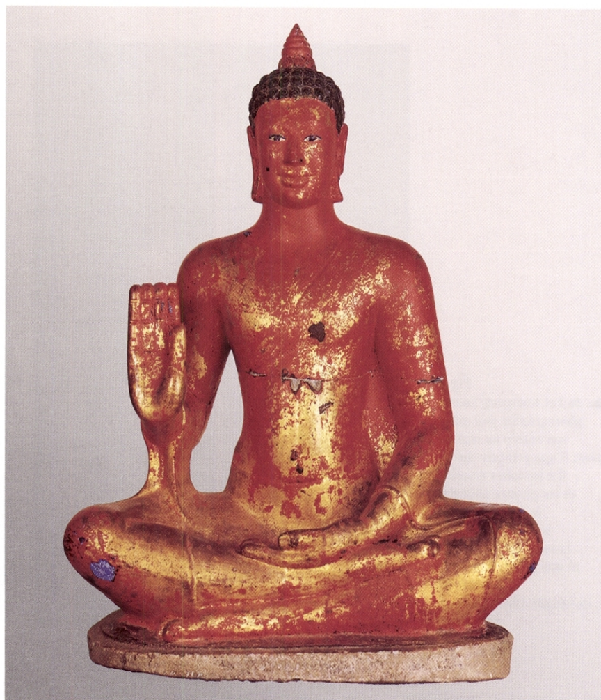
Fig. 3 Le Buddha en 2000, après la première partie de la restauration qui fait apparaître la couche de laque rouge [phase III], se présente à peu près dans l'état où il était en 1944; l' uṣṇīṣa , le cou surélevé, les genoux remodelés et les doigts allongés sont encore en place

A ce stade, un choix déterminant devait être fait. Des arguments religieux poussaient à conserver l'œuvre dans cet état finalement assez grossier, voire peut-être avec une harmonisation de la dorure. Aller plus loin dans la « dérestauration » risquait