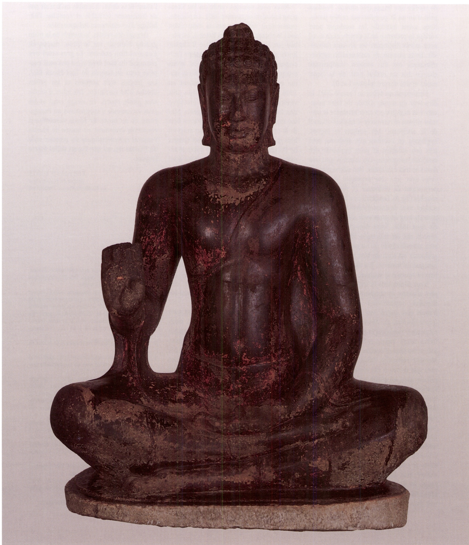
Fig. 5 Le Buddha en 2001, au terme de la restauration, avec sa forme d'origine et les restes des premiers enduits [phase I], tel qu'il est actuellement exposé au Musée de Phnom Penh