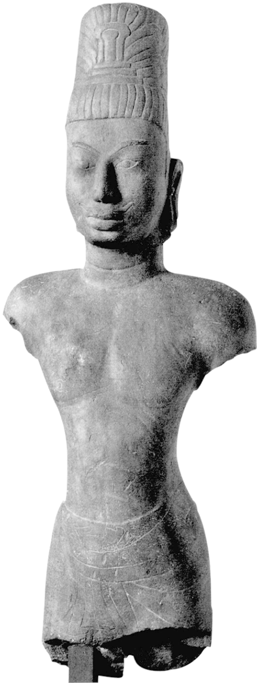
Fig. 2 Corps masculin (tête et corps assemblés: H. 117 cm; L. 52 cm; P. 25 cm). Grès gris bleu à grain fin. Provenance inconnue, Musée national de Phnom Penh