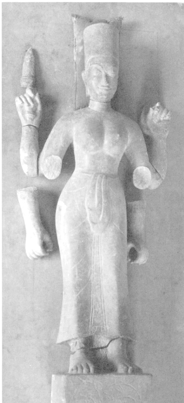
Fig 3b Durgā Mahiṣāsūramardīnī, en cours de restauration, Musée national de Phnom Penh, Ka 2927