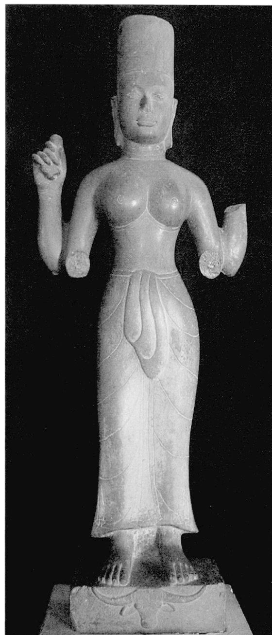
Fig. 4 Durgā (H. 106 cm). Grès. Tuol Komnat, province de Prey Veng, style de Prei kmeing, fin VII e -début VIII e s., Musée national de Phnom Penh, Ka 1631

ressemblant à la «patine» naturelle du grès.