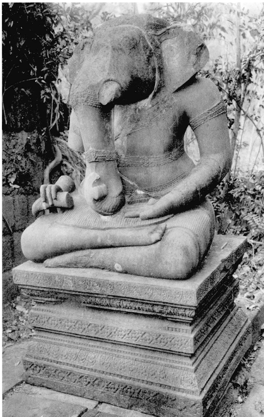
Fig. 5b Gaṇeśa, aujourd'hui disparu (H. avec la base: 251 cm). Grès, x e s. Prasat Bac, Koh Ker, 1934

Le caractère exceptionnel de cette pièce a cependant été remis en question lorsqu'elle a été exposée au musée, à côté d'une autre image de même époque et de mêmes proportions, la Durgā de Tuol Komnap 2 (fig. 4). La comparaison faisait progressivement naître une étrange impression. La Durgā de Tuol Komnap apparaissait comme le modèle qui aurait fortement inspiré sa voisine, mais comme un modèle mal compris: le hanchement, qui balance de l'autre côté, excessivement marqué, presque outrancier; les pieds plus lourds; le démon buffle traité seulement par une incision. Ce fut comme si un voile tombait soudainement, et la nouvelle ronde-bosse, pourtant bien exécutée, apparut de facture «plate».