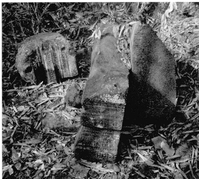
Fig. 5a Fragments de la base de la statue de Gaṇeśa. Prasat Bac, Koh Ker, janvier 2004

Ce trouble, ajouté au sentiment que nous avons eu lors de la restauration de la pièce dont les joints cassure étaient si parfaits, comme tout récents, nous permettait de mettre en doute l'authenticité de cette sculpture.