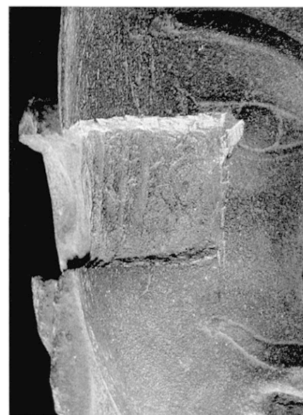
Fig. 1b Tête, coupe de la couche épidermique (cf. fig. 2)