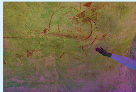
▲ Boviné à cornes en U traité dans de grandes dimensions, en style Têtes rondes . À droite, une vue rapprochée de la même scène après un traitement DStretch-CRGB.