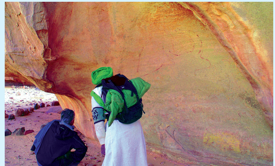
▲ Même site que sur la page de gauche, après un traitement DStretch-LDS de la photo.