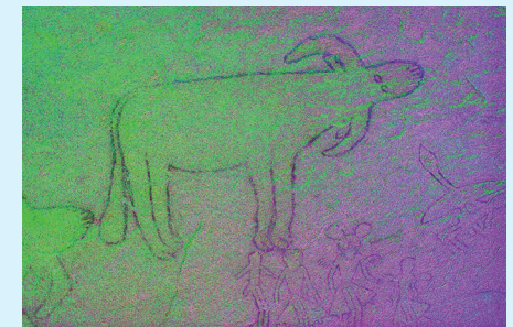
▲ Boviné à cornes en tenaille dirigées vers l'arrière (très probablement un buffle) menacé par un archer. À droite, la même image après un traitement DStretch-CRGB.