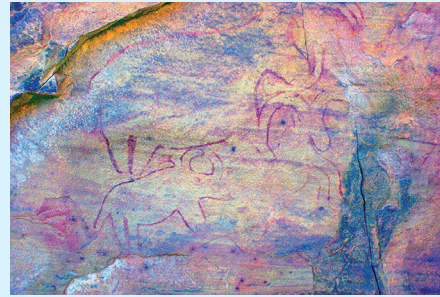
▲ Bovinés et mouflon en style Têtes rondes . À droite, image après traitement DStretch-LDS.