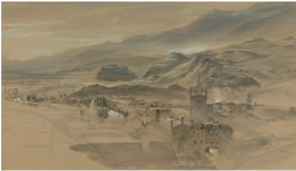
Figure 2. John Ruskin. A View of Susa, Italy, from the West , 1858 11

acteur politique influent opposant au capitalisme. Géologue et minéralogiste, il connaît bien les Alpes suisses, françaises et italiennes. L'idée maîtresse qui se dégage de sa correspondance est celle du respect de l'environnement naturel comme patrimoine commun et le droit de chacun d'y vivre et de le contempler aussi bien pour les habitants que pour les voyageurs. Témoin de l'évolution des infrastructures dans les Alpes, Ruskin y voyage depuis son enfance et y fait des séjours réguliers toute sa vie. En 1854 s'ouvre la ligne de chemin de fer reliant Turin à Suse. Elle court sur 53km et le trajet dure 1h30 10 . De mai à août 1858, Ruskin fait un itinéraire dans les Alpes suisses, italiennes et françaises. Il passe deux mois dans le Piémont et témoigne des changements infrastructurels dans une suite de missives. Il y exprime le paradoxe du passage d'un territoire vivant à un territoire en voie d'extinction alors même que les infrastructures ferroviaires se développent pour le rendre accessible.